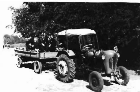
Strai pożarne zamyka pochod