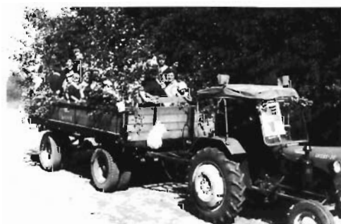
Czotówke sprzeta mecha- micznego