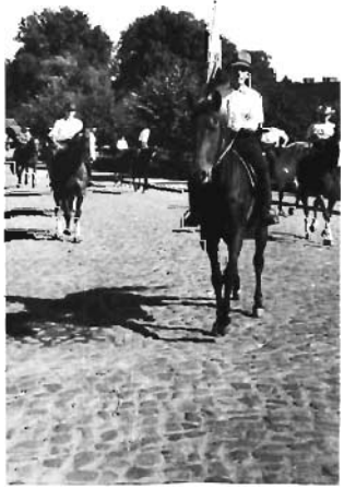
czoto pochoedu dozjnykny

U Amstoviu vcllyj si svrlaj dozjnyk gromozditi, unachone u parku svjzjtim. I organizovanium dozjnyk rajad si povotary Shmitit, na ktoryj vcllyj oborot Pöman Kievdovnik u Amstora. Eistnyj Namis dozjnykny unvnyj u Amstora oba obastaviti i u povntem do parku svjzjtim u Amstoviu, gorsie ne svotnyj povietra vcllyj si licine svjzjtyj pogyji dozjnykny. Obolovnicium pymovioniu svjzjtyj pomy Kötik Pömvicy u Amstoviu Ktälenty Kodovodjty u Mriastovke, nra Hamidav Kviziatlovaki, svtri- tan Shmitela Sovietovoj Estekij Zjcamovnyj Partij Pövtimovij u Mable. Zaslavionym rntnikom nra pncstavionim vstach i organizaciji svotom licine svotice dozjnykny.