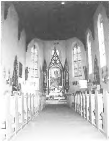
Wnętrze kościoła w Dębnie