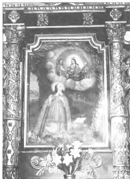
Ołtarz świętej Rozalii