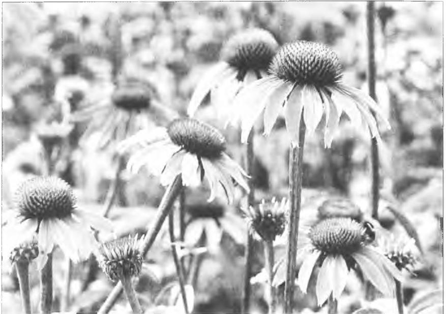
Plantacja jeżówki purpurowej

niu przewlekłych i ostrych infekcji bakteryjnych oraz wirusowych takich jak grypa, przeziębienie, stany zapalne górnych dróg oddechowych, a także podczas długotrwałego podawania antybiotyków, przy wyczerpaniu i osłabieniu organizmu, skłonności do infekcji górnych dróg oddechowych.