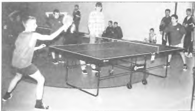
fol. J. Stachowiak

W pierwszej połowie stycznia w Kolniczkach odbyły się mistrzostwa gminy, a później powiatu w tenisie stołowym. Organizatorami imprez byli: SZS, SP w Kolniczkach oraz Urząd Gminy w Nowym Mieście.