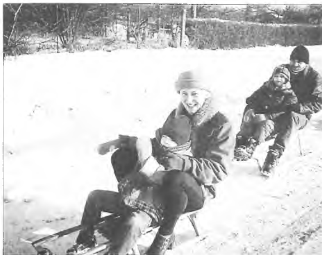
Kulig zorganizowany przez przedszkole w Chociczy

Zimowe ferie rozpoczęły się rzeczywiście zimowo. Śnieg, piękna pogoda, czas wymarzony przez dzieci małe i duże.