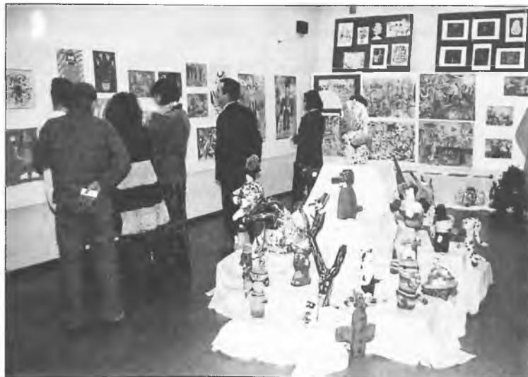
Wizualizacja szkolnej galerii