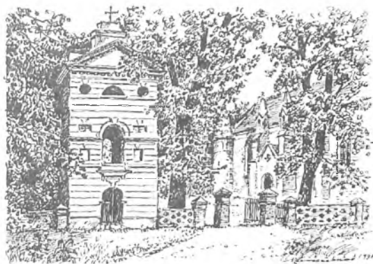
Kościół p.w. Wniebowzięcia NMP i dzwonnica w Dębnie

Dębno jest zakątkiem gminy o szczególnie bogatej historii. Jej ślady pozostały do dzisiaj. Najcenniejszym i najstarszym zabytkiem jest gotycki kościół p.w. Wniebowzięcia NMP, wzniesiony w połowie XV wieku przez pochodzącego stąd prymasa Wincentego Kota.