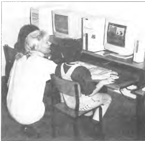
Pierwszoklasiści z opiekunką w sali komputerowej w Chociczy