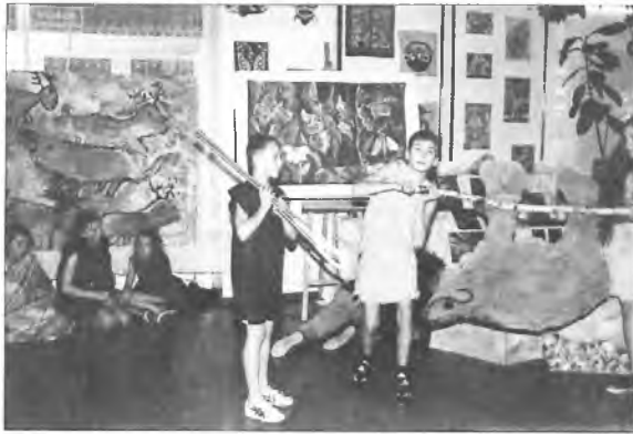
Przedstawienie „Dzień z życia człowieka prehistorycznego”

21 stycznia odbyło się spotkanie w Szkole Podstawowej w Klęce. Przybyli na nie przedstawiciele powiatu, kuratorium oświaty, starostwa, reprezentanci Zakładu Phytopharm, Muzeum Narodowego w Poznaniu oraz wielu zaproszonych gości.