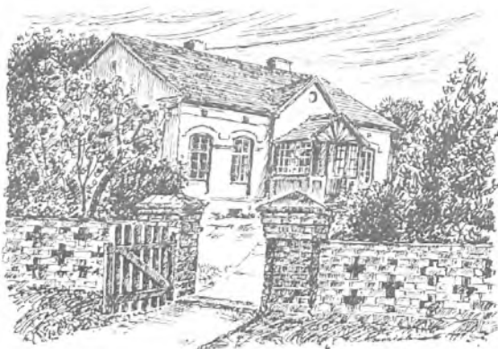
Plebania w Dębnie - widok od strony kościoła