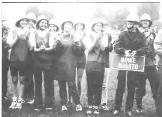
Dziewczęta z OSP Nowe Miasto

Zawody składały się z dwóch konkurencji: biegu sztafetowego i ćwiczeń bojowych. Zawodom przyglądał się wójt gminy