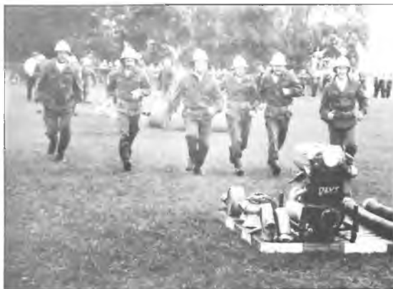
Drużyna męska z Klęki podczas zawodów

W biegu sztafetowym najszybsi byli seniorzy z Ochotniczej Straży Pożarnej Chromiec, następnie Klęka, Boguszyn i Wolica Kozia. Ćwiczenia bojowe i przeciąganie liny wygrali strażacy z Klęki. Chromiec w ćwiczeniach bojowych zajął drugie miejsce przed Boguszynem i Wolice Kozią, która w przeciąganiu liny zajęła drugie miejsce przed Chromcem i Boguszynem.