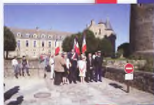
Przygotowanie do parady 14 lipca