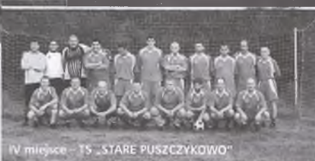
IV miejsce – TS „STARE PUSZCZYKOWO”