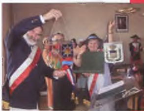
Herby – podarunek z Puszczykowa autorstwa K. Niewczyka