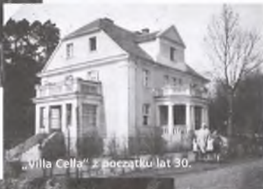
„Villa Cella” z początku lat 30.

napis na domu – „Villa Cella”. Od tego czasu czuje się już jak u siebie. Z czasem w przypływie zapewne wymuszonej dobroci adoptuje zgermanizowane dziecko z sierocińca. Od tego czasu mała