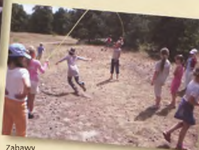
Zabawy dzieci na Zakolu Warty

Warsztaty pt. „Podróż z Arkadym Fiedlerem do różnych kultur” zostały zorganizowane w lipcu dla prawie 40 dzieci, przez Fundację A. Fiedlera. Główny ciężar finansowy poniosł Urząd Miejski. Impreza została zorganizowana z okazji obchodów Roku Dialogu Międzykulturowego. Dzięki takim warsztatom dzieci miały szansę poznać nowe kultury, oddalone o setki kilometrów od ich miejsca zamieszkania oraz inne obyczaje, zachowania i zwyczaje.