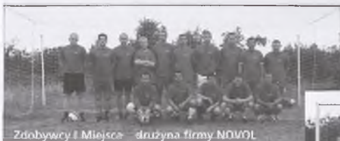
Zdobywcy I Miejsca – drużyna firmy NOVOL