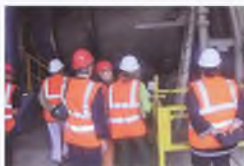
Zwiedzanie spalarni śmieci w Vitre