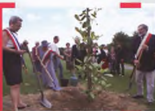
Sadzenie drzewka przyjaźni