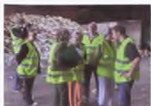
Wizyta w zakładzie segregacji odpadów