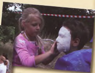
Dzień afrykański – odlewanie masek