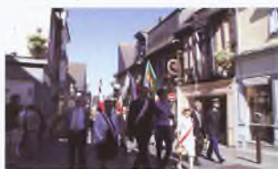
Przemarsz przez Châteaugiron