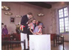
Podpisywanie dokumentu o dalszej współpracy