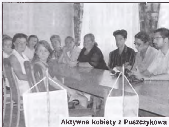
Aktywne kobiety z Puszczykowa

Osoby fizyczne, zamieszkałe w Puszczykowie (zameldowane) mogą składać wnioski o dofinansowanie likwidacji wyrobów zawierających azbest w obiektach znajdujących się na terenie Puszczykowa.