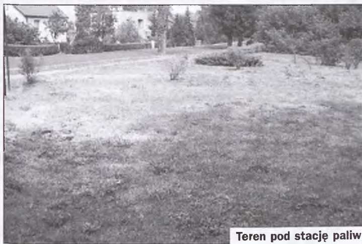
Teren pod stację paliw

O dalszym toku sprawy będziemy Państwa informować na łamach Echa Puszczykowa. Alina Stempniak