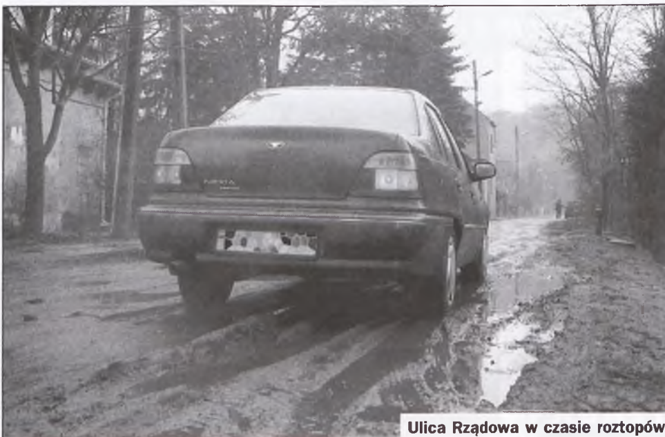
Ulica Rządowa w czasie roztopów

- Okazało się, że po utwardzeniu nawierzchni, trzeba by dokonać regulacji wysokości zaworów wodnych oraz kratki od kanalizacji deszczowej. By uniknąć tych kosztów proponujemy położenie na tej ulicy warstwy masy bitumicznej.