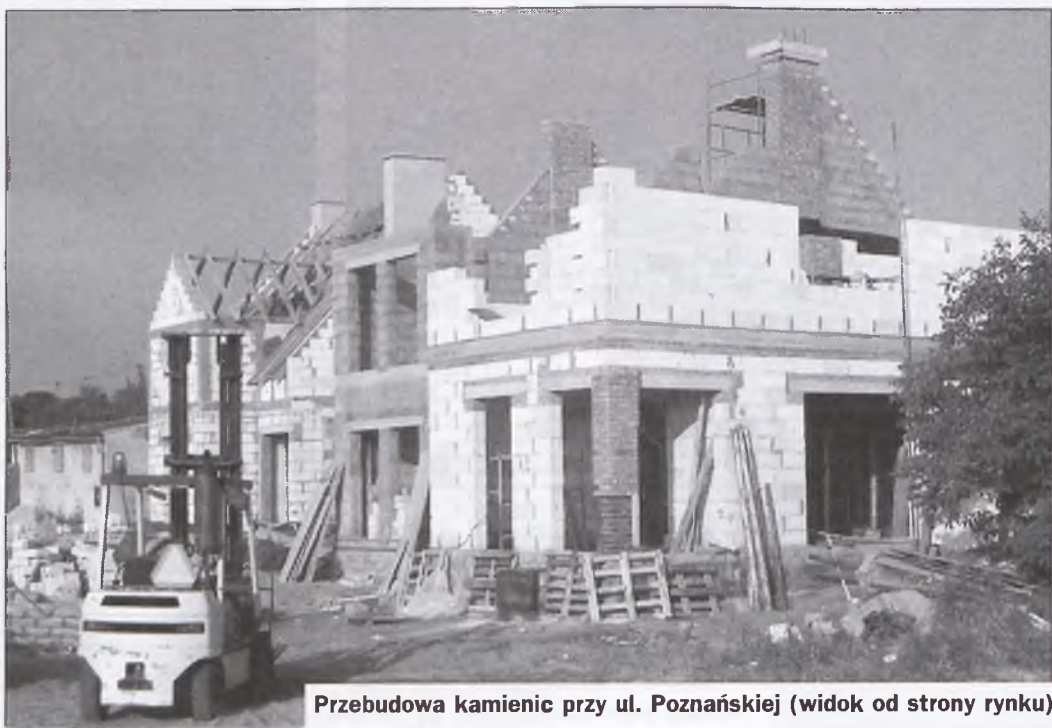
Przebudowa kamienic przy ul. Poznańskiej (widok od strony rynku)