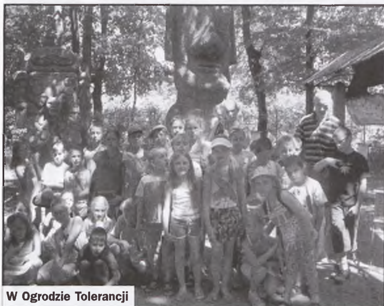
W Ogrodzie Tolerancji