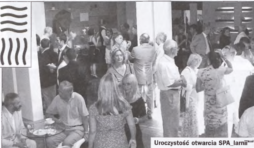
Uroczystość otwarcia SPA_larnii kcal

wo było kurortem, do którego przyjeżdżali na wypoczynek nie tylko poznaniacy. To właśnie tutaj ludzie nabierali sił i odpoczywali. Jestem przekonany, że kompleks SPA jest kolejnym krokiem w przywracaniu tej dobrej tradycji.