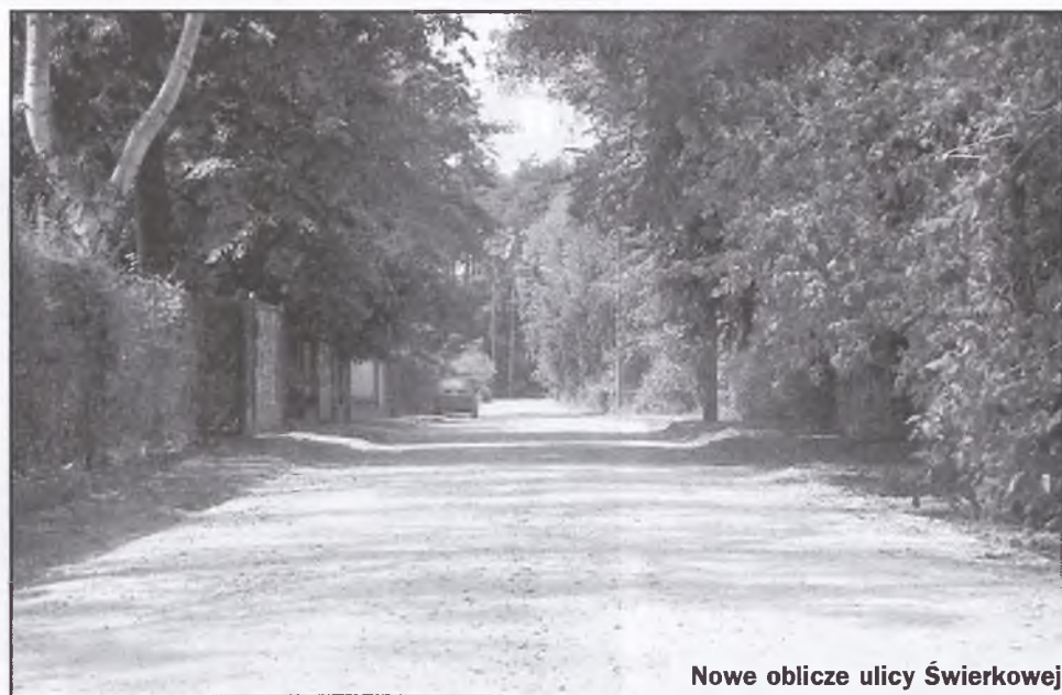
Nowe oblicze ulicy Świerkowej

- Została zaprojektowana tak, by w jak najmniejszym stopniu ingerować w przyrodę. Wycięte zostały krzaki i samosiejki. To właściwie były nieuporządkowane chaszczki i kilka nie dużych drzew. Ścieżka została tak zaprojektowana, by je omijać lub oplatać. Nasza ingerencja była więc świadomym kształtowaniem przyrody przydrożnej! Nowo usypa na skarpy szybko obrośnie drzewami i nowymi krzewami.