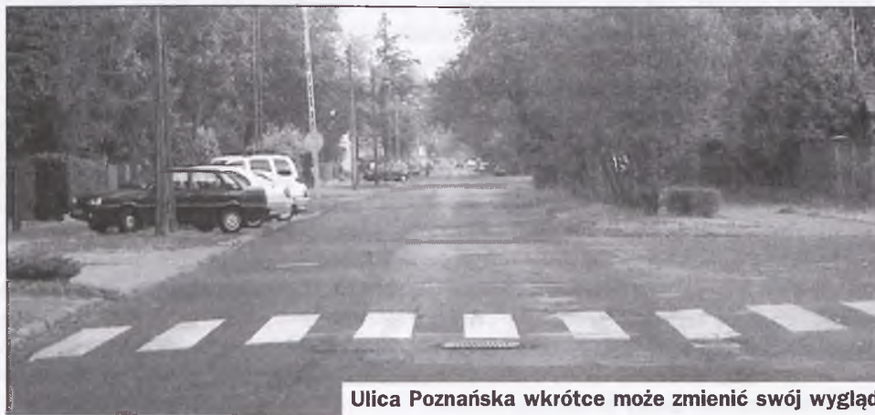
Ulica Poznańska wkrótce może zmienić swój wygląd

o dofinansowanie ze środków Europejskiego Funduszu Rozwoju Regionalnego uzyskał pozytywne opinie formalne oraz merytoryczno-techniczne od Departamentu Rozwoju Regionalnego Urzędu Marszałkowskiego i został przekazany do Regionalnego Komitetu Sterującego. Od opinii tego ciała zależy, czy otrzymamy środki na modernizację ulicy Poznańskiej jeszcze w tym roku. Red