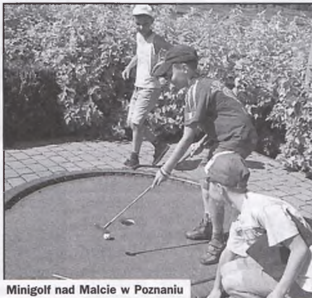
Minigolf nad Malcie w Poznaniu