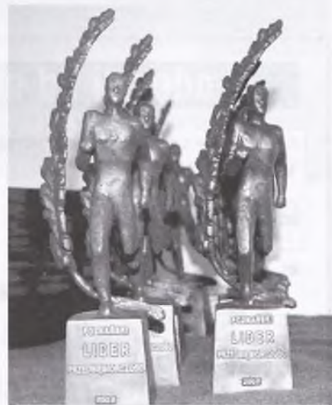
Zwycięzcom wręczono statuetki „Lidera”

W dotychczasowych edycjach konkursu wzięło udział 130 firm. Tegorocznymi Liderzy wybrani zostali spośród 40 zgłoszonych kandydatur. Każda z nich poddana została merytorycznej ocenie prowadzonej działalnością oraz analizie finansowej. Przedsiębiorstwa rekomendowane były przez Komisję Konkursową, a następnie za-