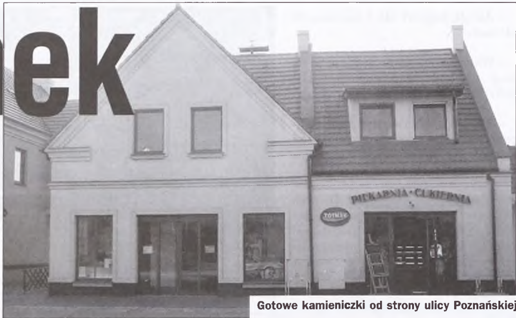
Gotowe kamieniczki od strony ulicy Poznańskiej

Patrząc na wyrastające budynki trzeba powoli zastanowić się nad nazwą rynku. Być może warto poprzestać na najprostszym pomysle i pozostać przy Ryнку lub Ryneczku, tym razem pisany z dużej litery? Może słuszniej będzie ustanowić adres przy ulicy Kościelnej, budynkom nadając tylko kolejny numer lub numer z literką? Co Państwo o tym myślicie? Może macie jakieś własne propozycje? Prosimy o listy do redakcji Echa. Propozycje prześlemy burmistrzowi. Red