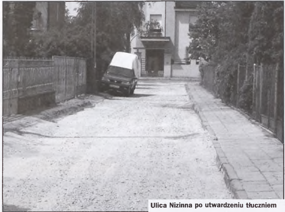
Ulica Nizinna po utwardzeniu tłuczniem

- Zastosowanie tego rozwiązania sprawi, że już najbliższa odwilż nie będzie straszna dla naszych mieszkańców. Wystarczy sobie przypomnieć wszechobecne błoto na wielu ulicach wiosną tego roku. Nie można było przejść czy przejechać samochodem. Po utwardzeniu tłuczniem na ulicy błota zwyczajnie nie będzie!