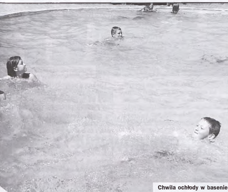
Chwila ochłody w basenie