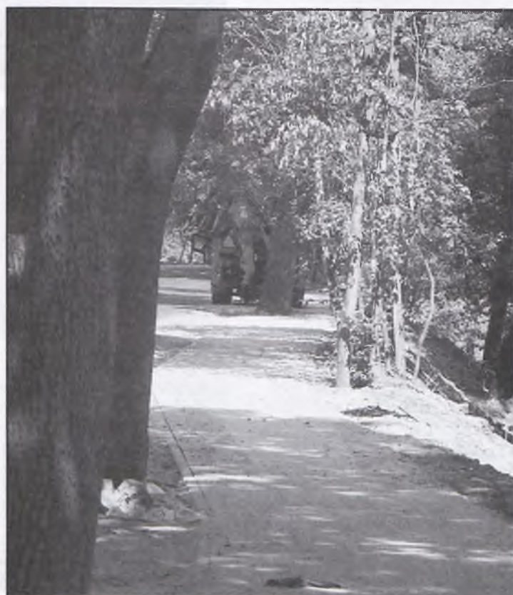
Ścieżkę poprowadzono tak, by zachować wszystkie duże przydrożne drzewa