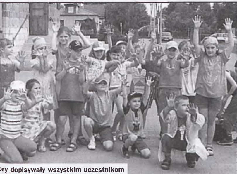
Opiekunowie dopisywały wszystkim uczestnikom