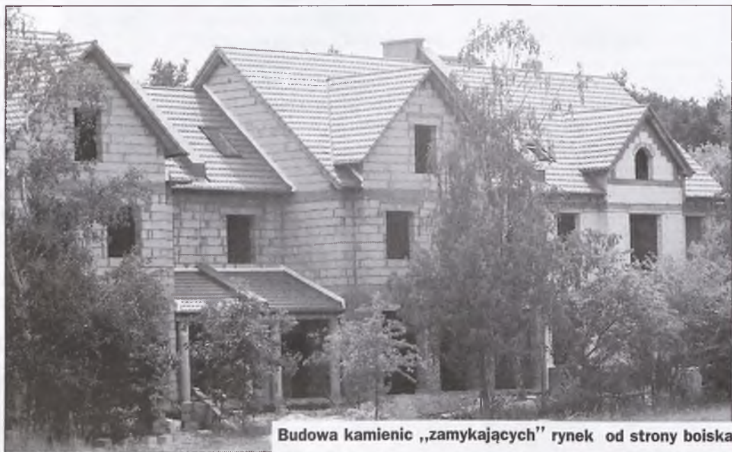
Budowa kamienic „zamykających” rynek od strony boiska