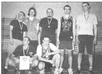
Puszczykowska Liga Piłki Koszykowej - I miejsce

Jak przystało na miano ligi mecze odbywały się pod kontrolą zawodowych sędziów. Sporządzano protokoły spotkań, prowadzono statystyki, a również nagrodzono najlepszych graczy, zdawano relacje na łamach „ECHA PUSZCZYKOWA”. Zwycięzcą ligi został zespół BEZ NAZWY. Ta grupa młodych ludzi jest już znana w Puszczykowie ze swoich sukcesów. To ona wygrała dwukrotnie rozgrywki podczas „Dni Puszczykowa”.