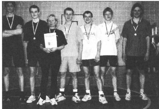
Puszczykowska Liga Piłki Siatkowej - 1 miejsce

Najbardziej emocjonujący był sam finał, w którym do samego końca ważyły się losy meczu. Pierwszy set należał zdecydowanie do drużyny OLD BOYS, która bez większych problemów wygrała 25:18. W drugim secie natomiast nieoczekiwanie zmienił się bieg wydarzeń i tym razem zwyciężył zespół LO 16:25. Decydujący trzeci set miał być rozegrany do 15 punktów, ale był dłuższy, gdyż obu zespołom zależało na zwycięstwie. Ostatecznie trzeci set tzw. time-break wygrał zespół LO 19:17 i tym samym zdobył pierwsze miejsce w całym turnieju.