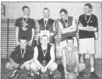
Puszczykowska Liga Piłki Koszykowej - II miejsce

Składy zespołów uczestniczących w finale: