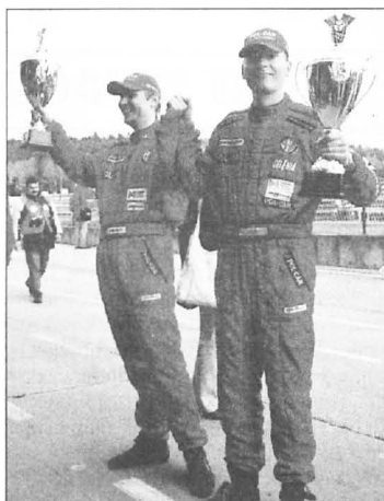
Puszczykowie na podium

deszczowych czy slick, bez bieżnika. Bo Alfa Romeo 156 to auta stworzone do sportowej walki w profesjonalnym stylu i dobór odpowiednich opon ma wielkie znaczenie. Ostatecznie do sprintu wykorzystano opony deszczowe. Natomiast do wyścigu głównego na obсыhającej nawierzchni toru - slick.