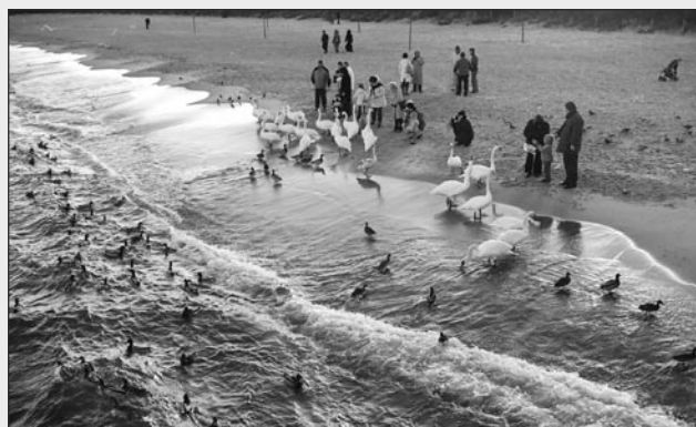
Zimowe dokarmianie ptaków na plażach to nie tylko troska o nie, ale już swoista tradycja.