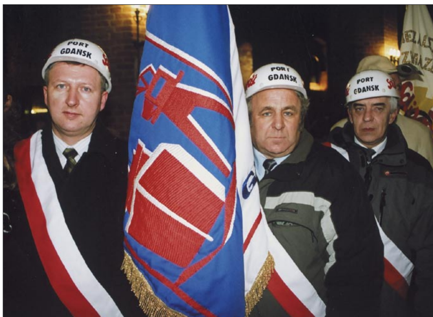
Poczet sztandarowy Portowej „Solidarności” biorący udział w uroczystościach...

Represje ustały dopiero po dojściu do władzy Edwarda Gierka. Jego