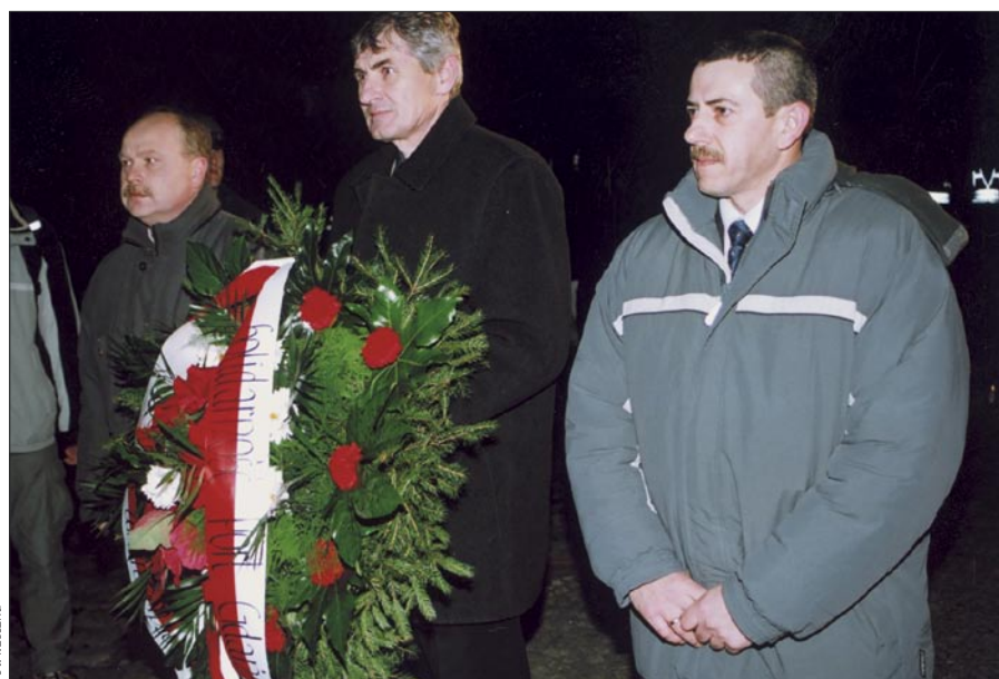
Delegacja Portowej „Solidarności” składa wieniec pod Pomnikiem Poległych Stoczniovców.

przyjazd do Stoczni Gdańskiej w dniu 25 stycznia 1971r. spowodował, że ustały napięcia strajkowe. Z podwyżek rząd wycofał się dopiero w marcu po spotkaniu z włóknierzami w Łodzi.