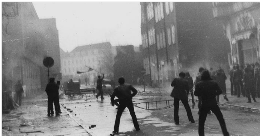
Zamieszki uliczne na Starym Mieście w Gdańsku.

„Solidarność” dąży do obalenia Konstytucji, władzy. Poczyniła ona przygotowania do przewrotu. W dniu 12 grudnia o godz. 20.30 podjęto wstępne działania do przygotowania stanu wojennego. Aktualnie jest pełna gotowość służb. W nocy zabezpieczono radio, telewizję, zablokowano łączność. Nie zanotowano incydentów. Zabezpieczono 320 obiektów. Zablokowano przejścia graniczne. Od godz. 24.00 przeprowadzano akcję internowania osób zagrażających bezpieczeństwu państwa. Dotychczas akcja została wykonana w 70%. Internowano m.in. Rulewskiego, Wądołowskiego, Pałkę, Kuroniów, Kułaja, małżeństwo Gwiazdów. Poproszono na rozmowy do Warszawy Wałęsę. Akcja trwa, największe kłopoty były w Gdańsku, zakończono akcję w Olsztynie. Internowano m.in. w Białej Podlaskiej 17 na 20, w Bielsku-Białej 98 na 120, w Chełmie 40 na 52, w Ciechanowie 11 na 13, w Katowicach 463 na 500, w Kielcach 176 na 196, w Koninie