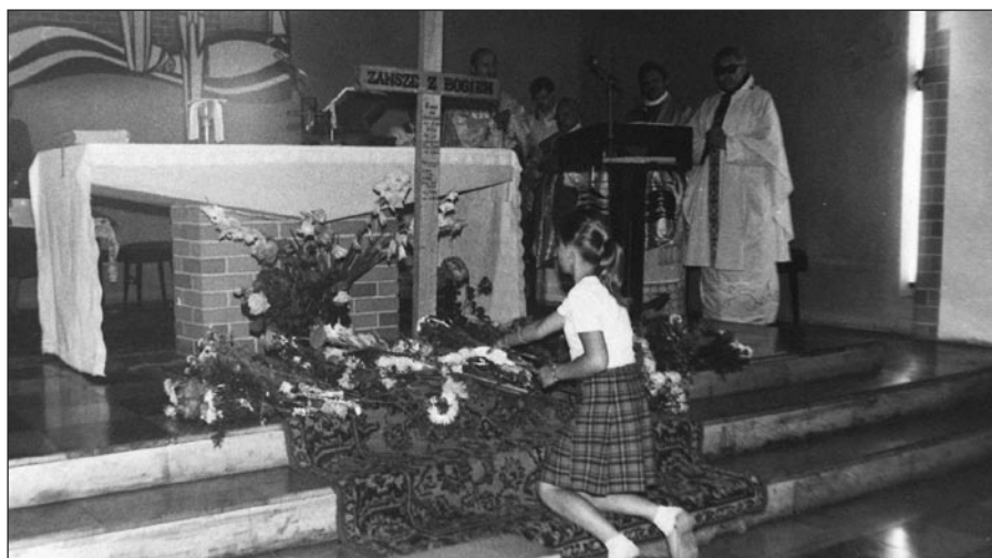
Jedna z uroczystości rocznicowych wprowadzenia stanu wojennego w marskim kościele w Gdańsku Nowym Porcie.