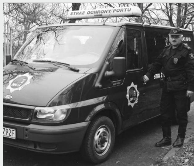
Straż Ochrony Portu Gdańsk dysponuje coraz lepszymi środkami transportu służącymi do skutecznej ochrony obiektów portowych.