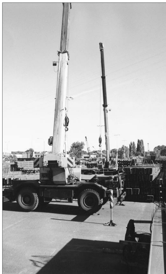
Rozładunek wyrobów stalowych w relacji wagon-plac w spółce PG Eksploatacja oddział Wiślany.