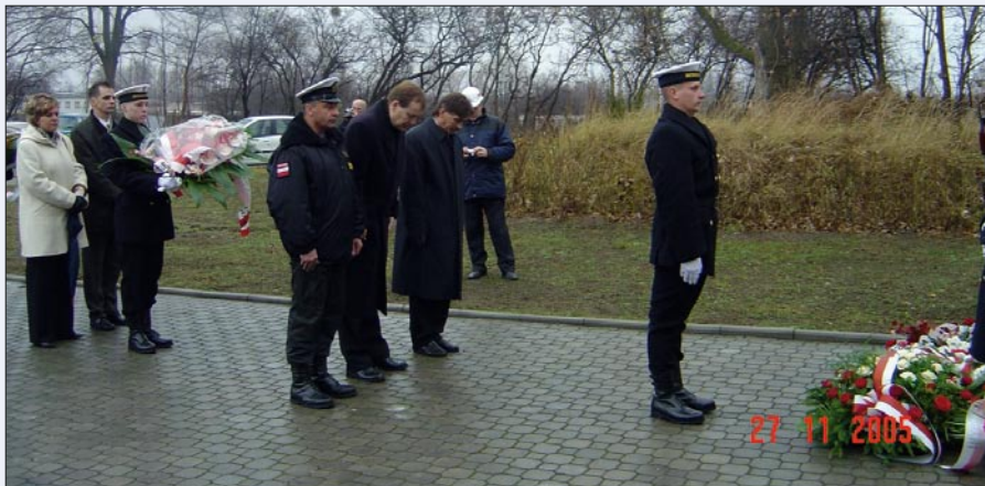
Wieńce dla polskich marynarzy składają przedstawiciele ZMPG S.A.