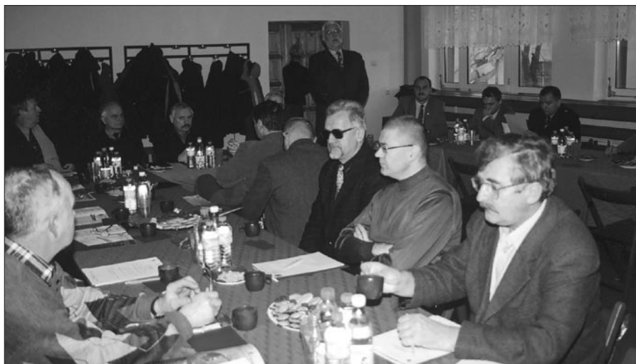
Uczestnicy Konferencji SOP Gdańsk w sali Zespołu Szkół Morskich w Gdańsku Nowym Porcie.

Ochrona terenów portowych oraz firm i ich majątku zlokalizowanego na tych obszarach wymaga stałego doskonalenia metod i systemów gwarantujących odpowiedni poziom bezpieczeństwa. Kierownictwo Straży Ochrony Portu Gdańsk dążąc do wzrostu bezpieczeństwa na terenie objętym ochroną podejmuje różne inicjatywy podnoszące efektywność pracy.