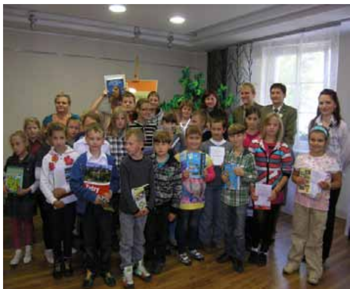
Laureaci i uczestnicy turnieju

W związku z przypadającym na rok 2011 Międzynarodowym Rokiem Lasów Biblioteka Publiczna w Trzciance zaprosiła uczniów powiatu czarnkowsko-trzcianieckiego do wzięcia udziału w wakacyjnym turnieju wiedzy o lesie – „Biblioteczne wędrówki przez bory i lasy”.