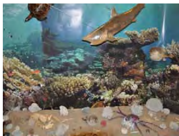
Fragment wystawy poświęconej stawonogom