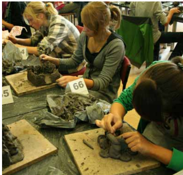
Uczestnicy turnieju w trakcie pracy

Wszyscy uczestnicy otrzymali zestawy gadżetów ekologicznych, natomiast zwycięzcom wręczono albumy i podręczniki z zakresu rzeźby i ceramiki. Nagroda Grand Prix to przenośny odtwarzacz DVD i album „1000 Genialnych Rzeźb”.