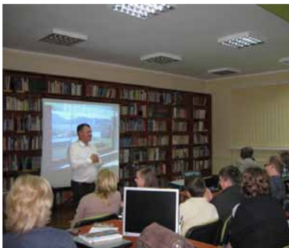
Tadeusz Chudecki w gostyńskiej bibliotece

Tadeusz Chudecki – aktor teatralny i filmowy, reżyser, poliglota gościł 11 i 12 października br. w Gostyniu i Pępowie zaproszony przez gostyńską Bibliotekę Publiczną. Znany przede wszystkim z roli Henia w popularnym serialu „M jak miłość”, tym razem wystąpił jako autor książek: „Wspaniałe podróże na każdą kieszeń, czyli Europa za 100 euro” oraz „Dalej w drogę. Łatwe i tanie podróżowanie po Europie, czyli wszystko, co turysta wiedzieć powinien”.