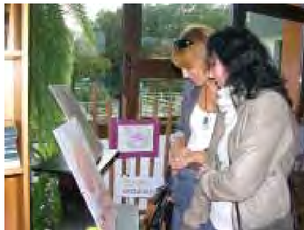
Fragment wystawy w Galerii Na Płocie