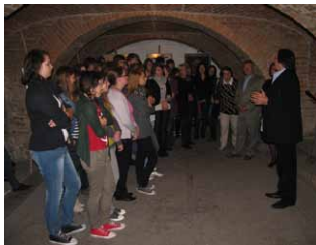
Zwiedzający wystawę w Galerii Lochy