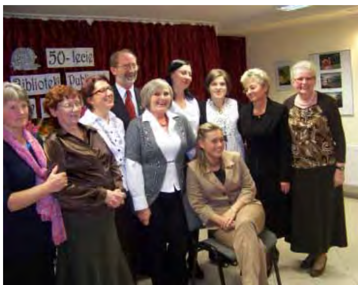
Pracownicy Biblioteki Publicznej w Komornikach

25 października w sali „Piwnica” obchodzono jubileusz 50-lecia istnienia Biblioteki Publicznej w Komornikach. W zorganizowanej z tej okazji uroczystości uczestniczyli m.in. przedstawiciele władz samorządowych, dyrek-