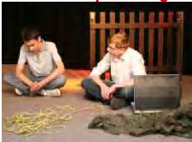
Teatr Młodzieżowy „Legenda”

16 października w Gminnym Ośrodku Kultury w Kazimierzu Biskupim odbyła się 20. edycja Przeglądu Małych Form Teatralnych „Prolog”. Te kameralne spotkania – skupiające pasjonatów rozmaitych form teatralnych – na stałe wrosły nie tylko w kulturalny kalendarz jego głównego organizatora i inicjatora – konińskiego Centrum Kultury i Sztuki, ale całego regionu. Przegląd stwarza platformę wymiany doświadczeń, doskonalenia warsztatu, a przede wszystkim – umożliwia prezentację (jako jedyny na terenie byłego województwa) tak