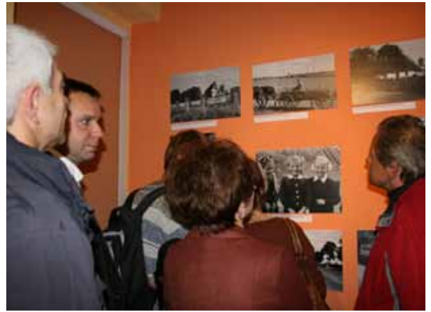
Wystawa „Konin jak Colorado”