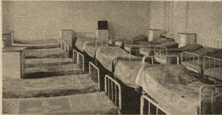
Jedna z sypialni Braci Albertynów dla chłopców w domu w Warszawie przy ulicy Grochowskiej 121.

Drżącymi rękami włożył płaszcz i wyszedł na ulicę. Wiatr uderzył mu w twarz. Drobny deszcz siąpił i spowijał go dokuczliwym zimnem, wchodzącym w każdą szparę płaszcza, rozchylającego się na wietrze. Ulica między starymi murami ogrodów była pusta. Nagle rozległy się w ciszy nieśpieszne, ciężkie kroki. Zdało się, że ołowianymi stopami, nie-