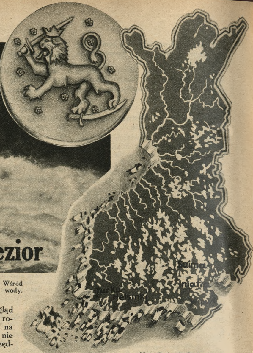
Mapa Finlandii. Białe plamy oznaczają jeziora. Wyżłobił

je przed tysiącami lat potężny lodowiec posuwający się z Szwecji i Norwegii. Na wschód od Finlandii leży Rosja, na północ Norwegia, od zachodu Szwecja, zatoka Botnicka, od południa zat. Fińska. W kole: Herb państwa Finlandii. W 12 wieku został ten kraj podbity przez Szwedów. Przeszło 600 lat później, w kilkanaście lat po naszych rozbiorach, zagarnęła go Rosja. Odtąd nastały dla Finów ciężkie czasy. Prześladowani — jak my — nie wyrzekli się odzyskania niepodległości. Stało się to w 1917 r. W ostatniej chwili chciała Rosja zadławić jeszcze Finlandię, darząc ją rewolucją bolszewicką. Stłumiono ją przy pomocy armii niemieckiej, za co Finowie są Niemcom szczególnie wdzięczni.