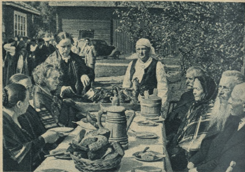
Fiński positek. Chleba takiego jak nasz, nie znają Finowie. Za to kilka razy w roku wypieka się smaczne placki z żytniej mąki, a potem wiesza w spiżarni.