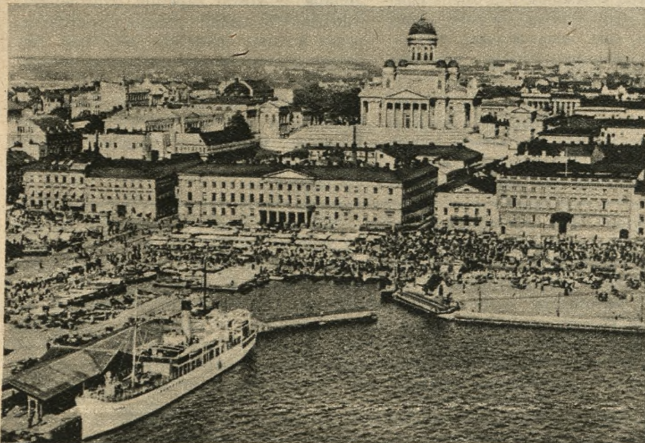
Na lewo: Helsinki (Helsingfors) — stolica Finlandii, zwana także „białym miastem północy”. Ma zaledwie 270 tysięcy mieszkańców (tyle co Poznań).

— Czapka! — Palto! — Woreczek! — Gdzież ten szalik? — No! Trudno! Prędszej! Prę-