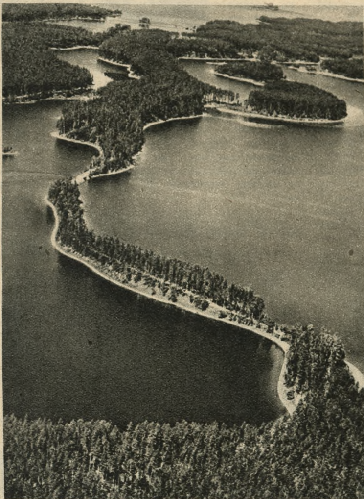
Punka-chariu, wspaniały labirynt jezior. Wśród wód ciągnie się 7 km długa, porośnięta świerkami smuga ziemi (pamiętka po lodowcach), zataczając malowniczo zakręty. Środkiem biegnie szosa. Ciemna ława drzew odbija się w nieruchomej tafli, a wszystko owiane jest ciszą i smętkiem.

Każdy, kto interesuje się sportem, słyszał wielokrotnie o fińskich biegaczach (Nurmi), pływakach, narciarzach. W Finlandii poczyna się rozumieć ich znakomite wyniki. Sport jest tu tak rozpowszechniony, że po prostu nie widać chłopca lub młodego człowieka bez odznaki jakiegoś klubu.