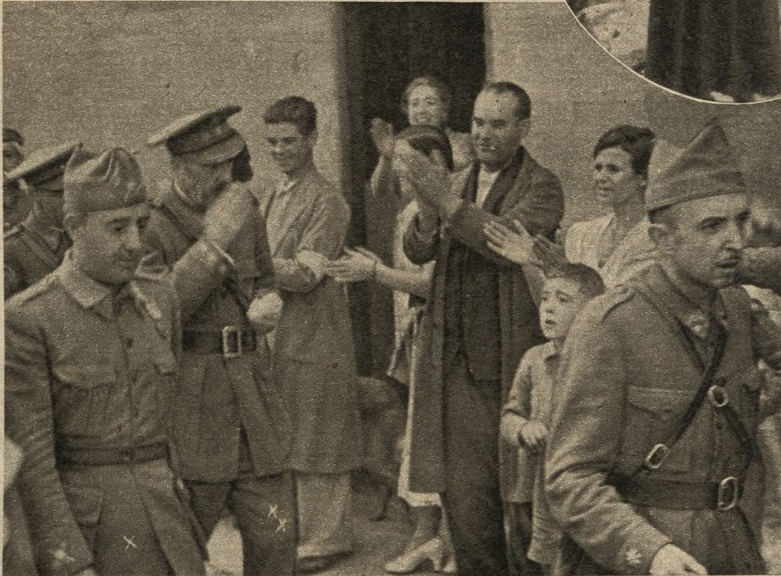
Obrońcy Alkazaru „oklaskują swoich wybawców”... Gen. Franko (X), Pulk. Moskrado (XX).

Bruk ulicy pławi się we krwi. Między trupami biegają dzieci, obładowane ciężkimi węzełkami. Ich twarze mają dziwny, ziemisty kolor cery. Tu i owdzie stoją gromadki żołnierzy. Spragnieni piją długimi łykami mleko; na twarzach ich osiadła bladeść szkieletów, a dokoła wystających kości policzkowych wiją się splecione kosmyki ciemnego, jakoby mocno zabrudzonego zarostu. Włosy podobniejsze do martwej