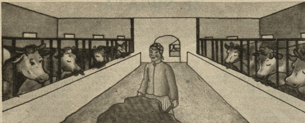
A żrycie mi — kochane krówki...

Świnie najbardziej wykorzystują ziemniaki. W czasie tuczu nie można ich jednakże zadawać w stanie surowym, gdyż tucz odbywałby