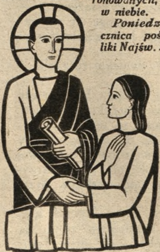
A gdy wygnano rzeszę wszedł i wjął jej rękę...

Sobota, 14. XI.: Św. Jozafata Bisk. i Męczennika. Pracował jako biskup w Połocku gorliwie nad zjednoczeniem prawosławia z Kościołem, za co został przez schizmatyków zamordowany we Witebsku dnia 12. XI. 1623. Ciało jego spoczywa obecnie we Wiedniu.