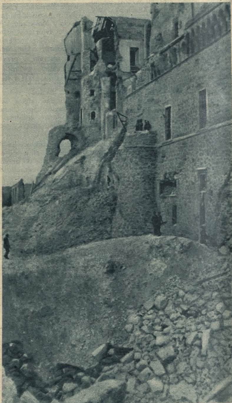
Pod murami Alkazaru po 70 dniach ognia huraganowego