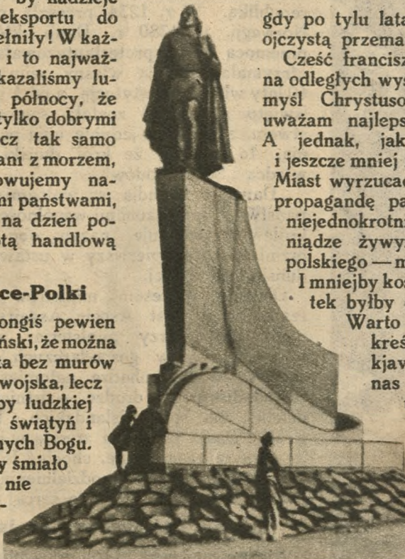
Przed wiekami Islandja była oparciem dla dalekich wypraw śmiałych żeglarzy północy — Wikingów. Oto pomnik jednego z nich, który, podobno na kilka wieków przed Kolumbem, odkrył Amerykę. Pomnik jest darem Stanów Zjednoczonych A. P.

Należy jej się za to szczególne uznanie.