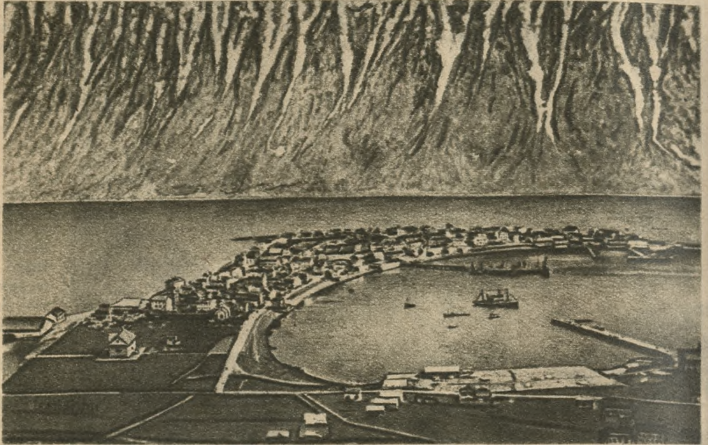
Na północnym zachodzie Islandji, w głębokim fiordzie leży miasto Isafjordur. Ściany fiordu stromo opadają ku głębokiej wodzie. Wobec ogromu skał domki wyglądają jak pudełka zapalek.

polska (przeszło 10 tys.), która nam na pożegnanie śpiewała nasze narodowe pieśni, to naogół jest wiadome, ale, że na takich wyspach odludnych Faröer czyli „owczych“, w samym prawie środku Atlantyku, lub w dalekiej Islandji spotkamy dusze polskie, tego nikt z pasażerów nie przypuszczał. Tem większą była radość, gdy w Thorshavn, na „Wyspach Owczych“ i tak samo w Reykjaviku powitały nas siostry polskie, które przed kilku laty opuściły strony rodzinne, by z całym zaparciem się siebie wśród obcych głosić Chrystusa, zarazem szerzyć kulturę polską, a co najważniejsze: uczyć dzieci w ochronkach śpiewać po islandzku: „Boże coś Polskę“! Aż łzy perlily im się w oczach,