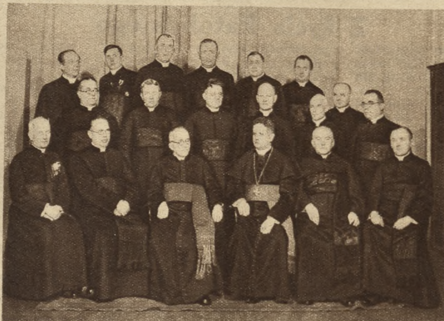
Fot. Rubens, Poznań.

Odpowiedź: Pismo św. opisuje prawdę. A prawda jest, że w Kościele jak i w Starym Zakonie żyli nie tylko ludzie święci, ale i grzesznicy. Świętych namyślać, grzeszników, w szczególności grzechy ich, mamy sobie obrzydzić. Prawdą jest i to, że w Starym Testamencie moralność nie stała jeszcze tak wysoko jak w Nowym, np. co do życia małżeńskiego. Prawo Mojżeszowe brało wzgląd na twardość serca żydowskiego. Mimoto stały obyczaje żydowskie o wiele, wiele wyżej, aniżeli obyczaje ludów pogańskich, pełne bezeceństw i okrucieństwa.