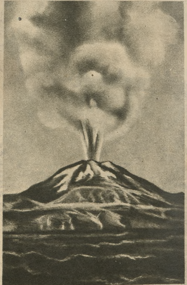
Islandja jest wyspą wymarłych i czynnych jeszcze wulkanów, z których największym jest Hekla. Znaczne połacie kraju pokryte są lawą, t. j. masą wylewającą się z wulkanów podczas wybuchów.

Dopiero w ostatnich latach katolicyzm rozkwitł w zdumiewający wprost sposób. W Thorshavn (ok. 5000 mieszk.) na wyspach Faröer, gdzie katolików jest zaledwie kilkunastu, wystawiono wielką kaplicę, szpital, mieszkania dla sióstr i ochronkę; w Reykjaviku zaś (na 23 tys. mieszkańców zaledwie 400 kat.) wspaniała katedrę w stylu nowoczesnym, panującą nad