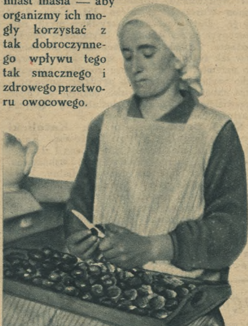
Ryc. 2. Ze śliwek należy wyjąć pestki

Powidła ze śliwek najlepiej smażyć w końcu września, lub w pierwszej połowie października, gdyż wtedy śliwki są najłodsze, — a powidła z nich najdelikatniejsze. W tym czasie potrzeba też do nich mniej cukru niż w porze wcześniejszej, kiedy śliwki nie są jeszcze tak bardzo słodkie. Powidła ze śliwek są bardzo zdrowe, zwłaszcza dla dzieci — ale tak samo i dla osób starszych. Najbardziej właściwością powideł jest to, że świetnie regulują żołądek. Nie potrzeba chyba zaznaczać, że zdrowy i regularny żołądek jest podstawą zdrowia i młodzieńczego wyglądu. Dlatego też powinniśmy jaknajwięcej tych powideł śliwkowych używać sami, i dzieciom również dawać ich dosyć dużo np. z chlebem zamiast masła — aby organizmy ich mogły korzystać z tak dobroczynnego wpływu tego tak smacznego i zdrowego przetworu owocowego.