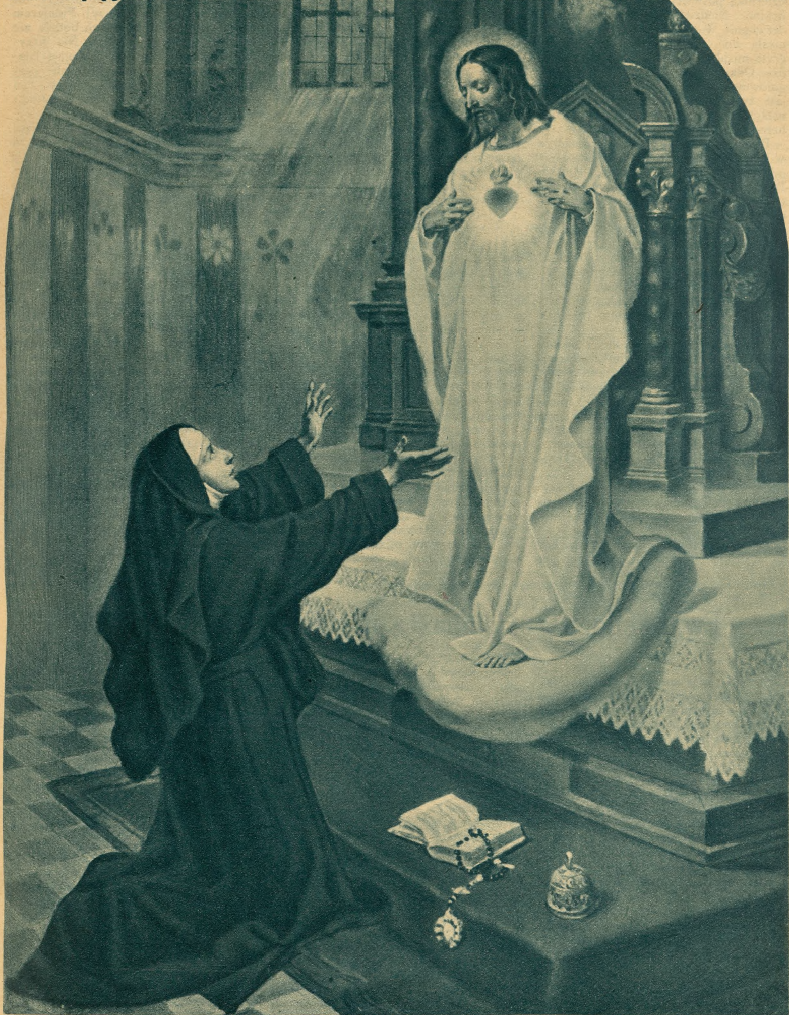
WIDZENIE ŚW. MAŁGORZATY ALACOQUE

Ilustrowany tygodnik dla rodzin katolickich - Redaktor założyciel X. Józef Klos, redaktor nacz. X. Fr. Forecki