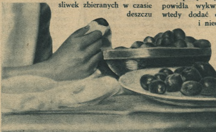
Ryc. 1. Najpierw trzeba śliwki wytrzeć suchą czystą ściereczką

Aby powidła dobrze się smażyły i konserwowały, trzeba na nie wybrać śliwki bardzo dojrzałe i zbierane w zupełnie suchy dzień . Powidła ze śliwek zbieranych w czasie deszczu