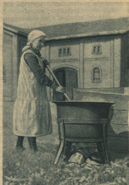
Ryc. 3. Smażenie powideł na dworze