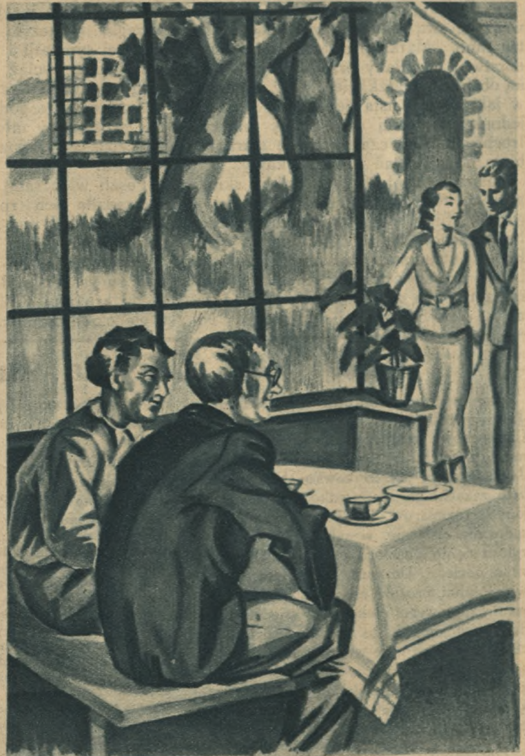
Sliczny przedstawia im się obraz: Piękna młoda para — radosna i szczęśliwa...

Wciąż jeszcze siedzi stary emeryt na tem samym miejscu, trzymając list nie-