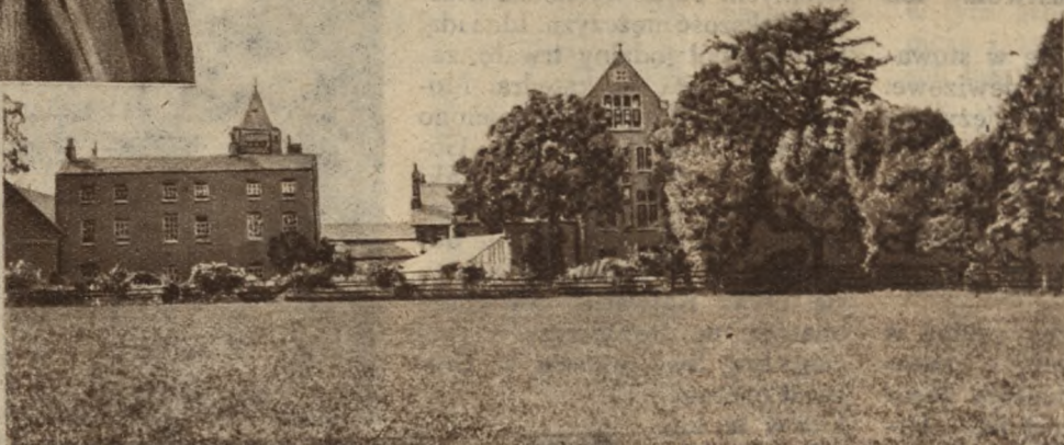
Klasztor w Roselands Walmer.

Za radą ś. p. ks. kardynała Ledóchowskiego, nadesłaną z więzienia