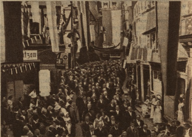
Procesja mężczyzn w czasie uroczystości jubileuszowych w Limburgu U góry: Katedra w Limburgu

stale swe nakłady. Zanim wyszedł zakaz wydawania katolickiego czasopisma „Junge Front“, bito go 160.000. Gdy zakaz cofnięto, nakład podskoczył na 270.000! To tylko mały dowód na bohaterstwo katolików niechęcych ugiąć się wobec nowoczesnego pogaństwa w kraju sąsiedzkim.