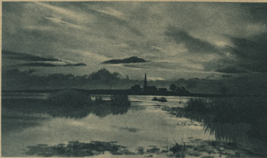
Cisza zupełna: Tofta jeziora gładka, wyrównana, sitowie ani drgnie. Spokój niezamącony idzie od pól i jeziora. Tymczasem pod powierzchnią wody ani na chwilę nie ustaje walka zacięta. Wodne porosty opadają stale na dno. Powoli, powoli dno się podnosi, także brzegi jeziora zarastają gęstą nieprzeziarną ławą roślin i tak te małe bezbronne roślinki toczą zaciętą bój z wodą, która ustąpić im musi. Walka ta trwa całe wieki. W ten sposób zamierają jeziora i powstają torfowiska. W takim to właśnie trzęsawisku odkopuje się obecnie osady nad brzegiem Biskupińskiego jeziora.

U góry: Naczynia gliniane i topory kamienne znalezione w Biskupinie. W jednej z odkopanych chat w Biskupinie odnaleziono stojącą na spalenisku skorupę naczynia z resztkami jakiegoś jadła. Wieś opuszczono widocznie nagle, może przed nadchodzącym wrogiem. Brak broni przemawia za wojną. Mężczyźni zabrali żelazo, kosztowało