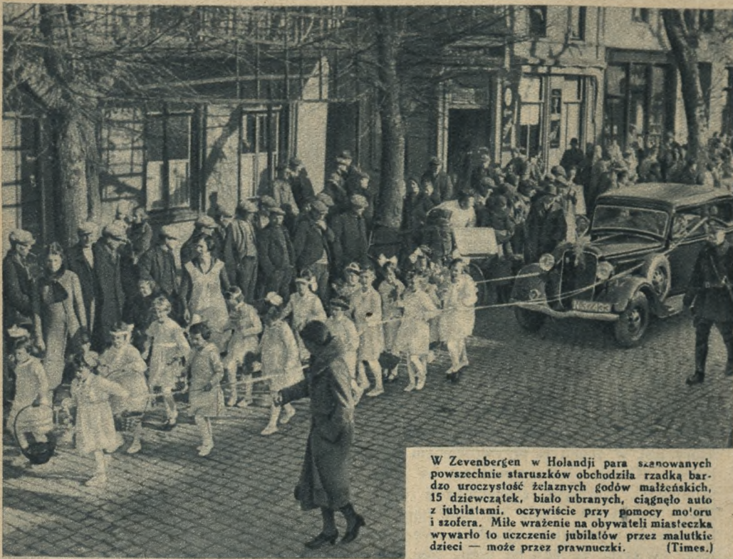
W Zevenbergen w Holandji para szanowanych powszechnie starszusków obchodziła rzadką bardzo uroczystość żelaznych godów małżeńskich, 15 dziewczątek, biało ubranych, ciągnęło auto z jubilatami, oczywiście przy pomocy mo'oru i szofera. Miłe wrażenie na obywateli miasteczka wywarło to uczczenie jubilatów przez malutkie dzieci — może przez prawnuczki. (Times.)