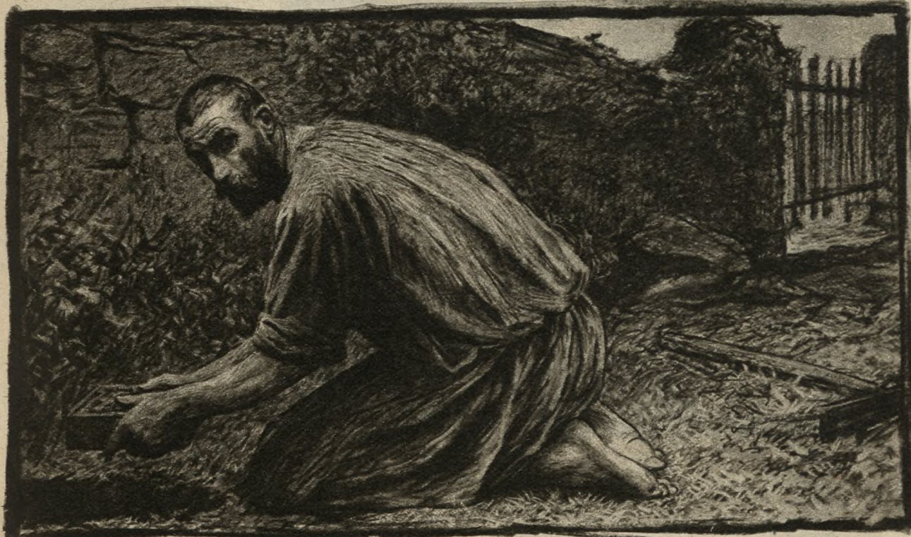
Skarb nad skarby.

„Z królestwem niebieskiem jest podobnie, jak ze skarbem, zakopany w roli. Znajduje go ktoś i zakopuje, a upojony radością z tego powodu, idzie, sprzedaje wszystko, co posiada, i nabywa nową rolę.“ (Mat. 13, 44.)