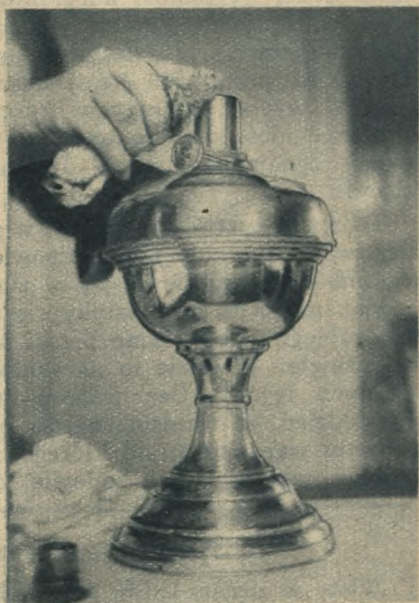
Knota nie należy obcinać za każdym razem. Powierzchnię jego wyrównuje się przez obcieranie suchą szmatką.