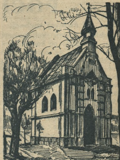
Na miejscu starej, stoi dziś piękna, w stylu gotyckim kaplica Rys. Lenczowski.

Po południu któregoś dnia zostały odprawione nieszpory, a po nieszporach miała wyruszyć procesja. Przy końcu