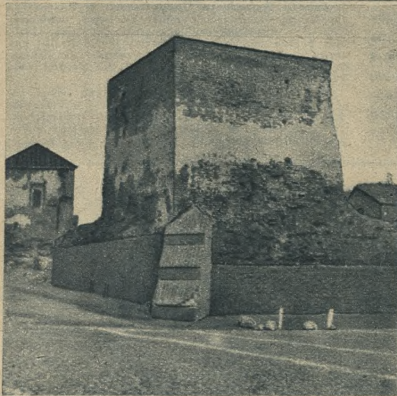
Wyżej. Baszta szlachecka wśród ruin zamku króla Kazimierza Wielkiego w Łęczyca (woj. łódzkiej). Według podań, krążących wśród ludu, w baszcie tej djabeł Boruta pilnował beczennych skarbów i płał różne psoty żydom i chłopom.