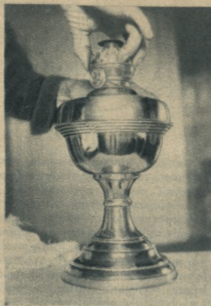
Dobrze! W ten sposób należy rozkręcać lampę!

Szczotki od czyszczenia cylindrów trzeba często prać w mydlinach, tak samo ściereczki przeznaczone do czyszczenia lamp powinny być utrzymywane w największej czystości. Z. G.