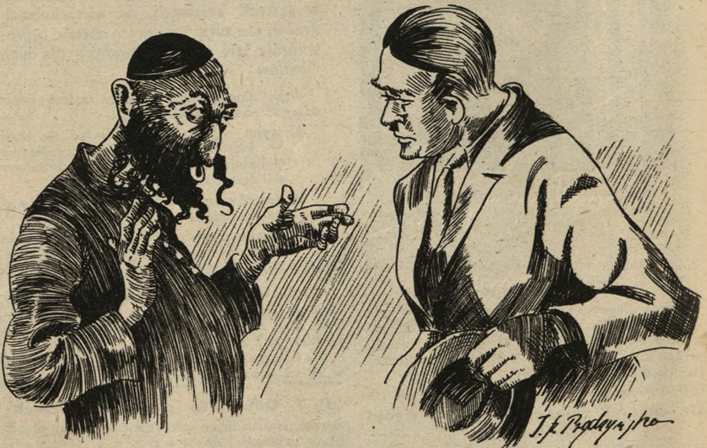
Czy ja panu Andrzejowi weksel wystawiłem?

— Jakie piniondze? Co za piniondze? Czy ja panu Andrzejowi weksel wystawiłem? Czy ja z panem Andrzejem kontrakt zrobiałem? Ja nic nie wiem o żadnych piniondzach!