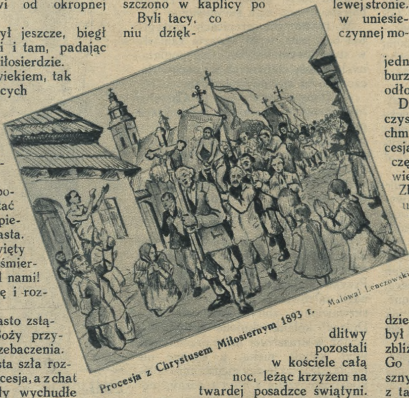
Procesja z Chrystusem Miłosiernym 1893 r. Malował Lenczowski.

dłitwy pozostali w kościele całą noc, leżąc krzyżem na twardej posadzce świątyni.