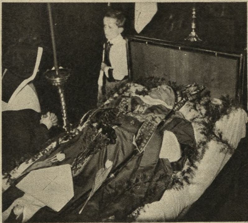
Śmierć Ks. Biskupa berlińskiego.