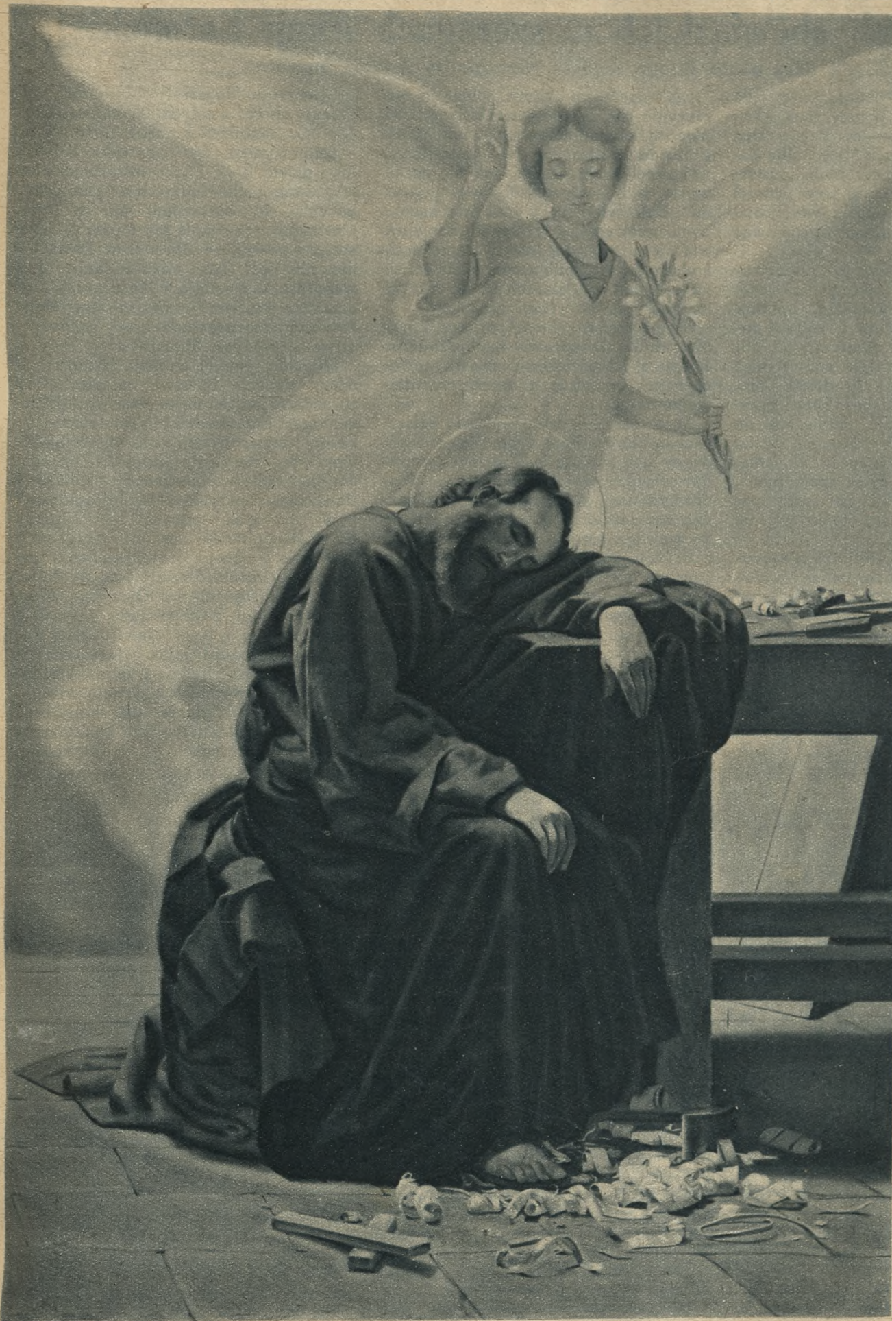
Obraz prof. Marinettiego w kościele Zbawiciela w Jerozolimie.

Na obrazku widzimy młodą, w pełni sił postać św. Józefa. Znużony pracą usnął przy swoim warsztacie. A nad nim zarys miłgiste skrzydlatego anioła z liłą w ręce, z palcem drugiej ręki, wskazującym niebo, skąd przybywa poselstwo niebieskie do ciesielskiego warsztatu.