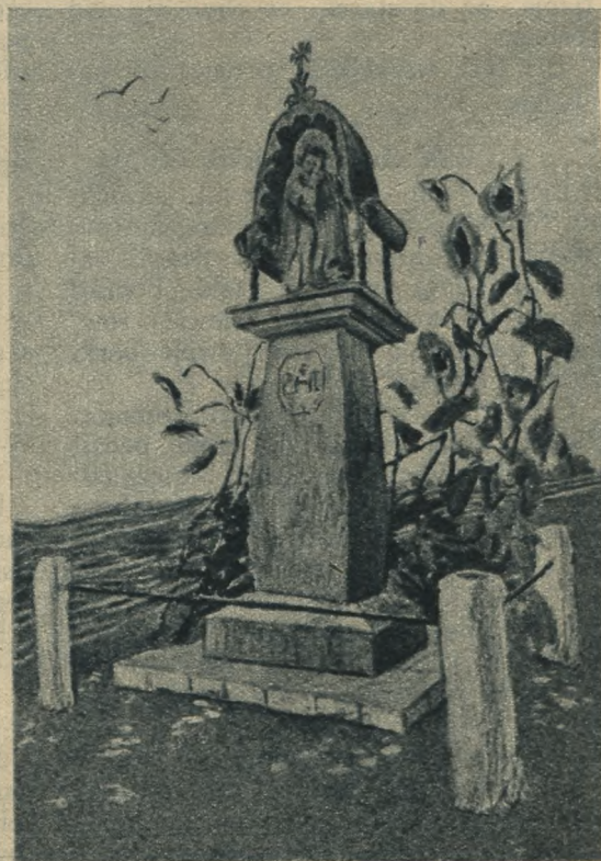
„Pan Jezus Miłosierny.“

Wśród zebranych odezwały się głosy, że widocznie Chrystus Miłosierny nie chce opuścić miasta. Proboszcz zmieszany oznaczył bardzo uroczystą procesję w niedzielę po nieszporach. Ten dzień także jak i poprzednie, piękny był i pogodny. W chwili jednak, gdy zbliżono się do posągu Zbawiciela, aby Go wziąć na ramiona, zerwał się straszny wichur i zatrzasnął drzwi kościoła z taką siłą, że tynk posypał się z mu-