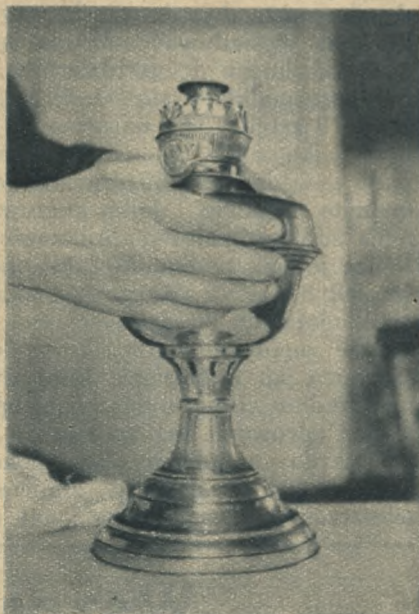
Źle! Przez odkręcanie palnika tym sposobem krzywimy śrubkę od podkręcania knota i psujemy lampę!