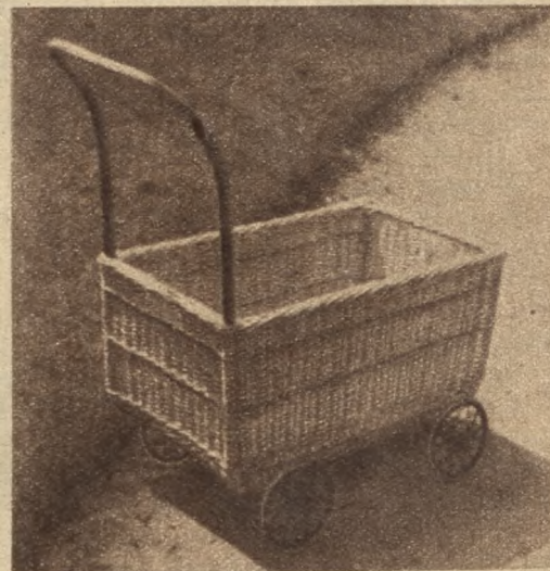
Praktyczny koszyk-wózek do bielizny.

Karabińczyki zakłada się na sznur, na którym wieszamy bieliznę i przesuwamy worek w miarę potrzeby, mając ciągle klamerki pod ręką. Taż sama wygoda jest i przy zdejmowaniu bielizny. Po odpięciu klamerki zamkamy je w worku, gdzie już bezpiecznie oczekiwać będą następnego prania. Rom.