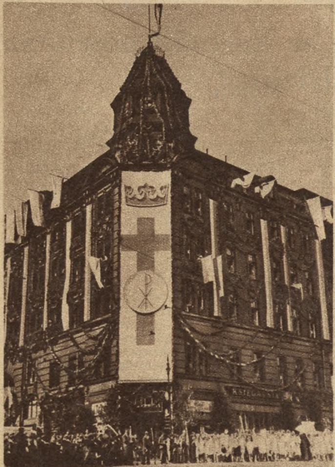
Pięknie przystrojony gmach Drukarni i Księgarni św. Wojciecha, w którym znajduje się także Redakcja „Przewodnika Katolickiego”.