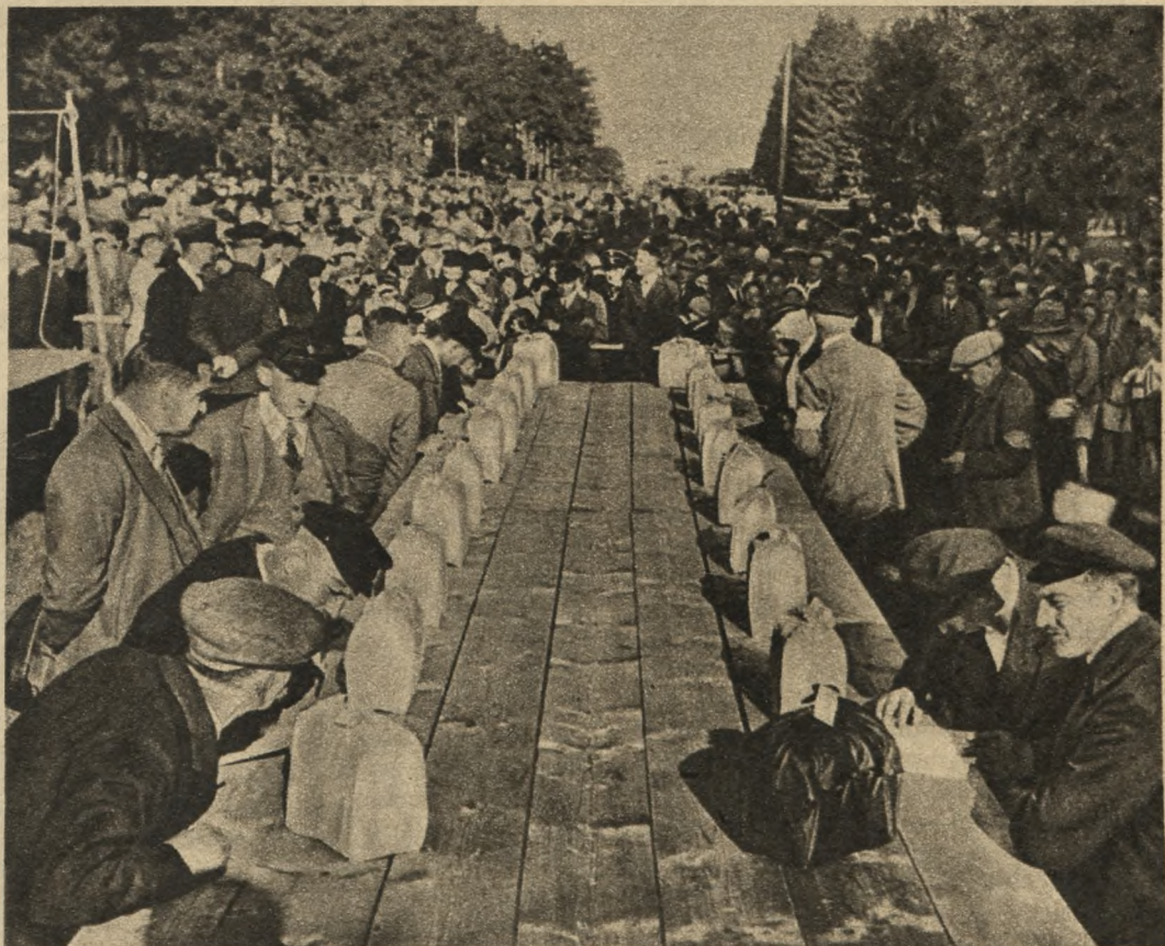
Oto obraz z konkursu zięb, odbywającego się w jednej z wiosek w Turynii.

Nazajutrz opuściliśmy ten dziwny kraj, w którym ziębki zamknięte w klatce popisywać muszą się na konkursach, i zwiedziliśmy kilka krajów, aż wreszcie osiedliśmy w tym lesie. Uwili-