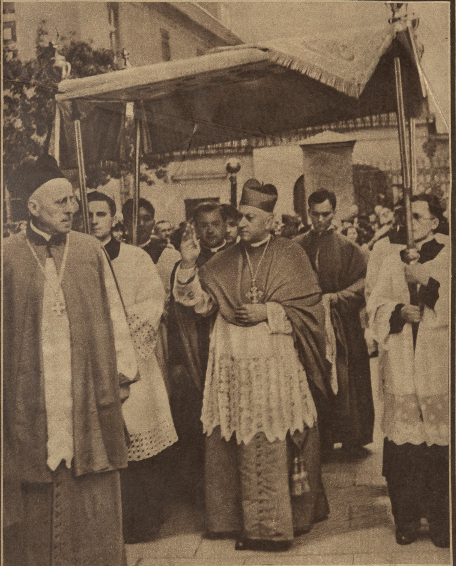
Legat Papieski, J. Em. Ks. Kardynał Dr August Hlond, Prymas Polski, w otoczeniu swej świty duchownej i świeckiej, udaje się do Katedry Poznańskiej. (W piątek 25 czerwca o godz. 16-tej odbyło się uroczyste wprowadzenie do Katedry Legata Papieskiego i nabożeństwo inauguracyjne.