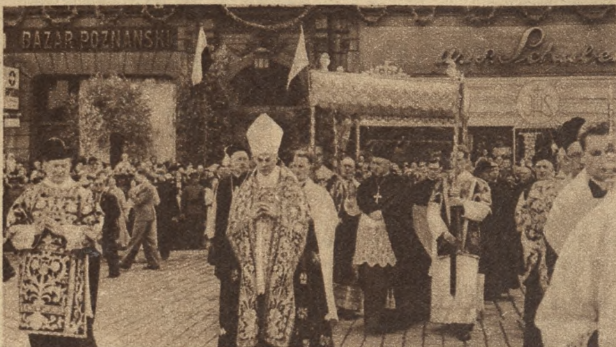
Legat Papieski Ks. Kardynał Prymas zbliża się w otoczeniu świty kościelnej do wielkiego ołtarza na Placu Wolności.