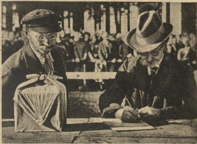
Skrupulatnie spisuje sędzia konkursowy każdy trzel zięby, ocenia go według ustalonych zasad, by sprawiedliwie najlepszemu śpiewakowi oddać palmę zwycięstwa.

francuski i odstąpił mi pewnemu gospodarzowi, który miał kilkadziesiąt morgów ziemi gdzieś w północnej Francji, koło wielkiego miasta Lille.