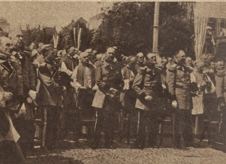
Dostojne grono Szambelanów Papieskich i Kawalerów Maltańskich.