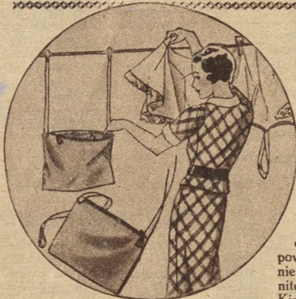
Torebka do klamerki bardzo praktyczna i wygodna.

Doczekał się wreszcie swej żony. Usiadł przy niej, wpatrywał się w nią czule, a potem zaśpiewał tak pięknie i tak radośnie, jak kiedyś pewnemu panu przed oknem oberży. Wedł. J. Sann.