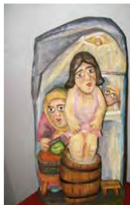
II Nagroda – R. Łuczak „Deptanie kapusty”