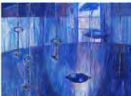
Gennadij Jeltsov, Sekrety 1, 2

Od 8 do 29 sierpnia w Muzeum Ziemi Wałeckiej w Wałczu można było oglądać wystawę pt. „Pejzaże wewnętrzne”. Prace artystów plastyków z Estonii, Łotwy, Rosji, Włoch i Polski podzielono na dwa cykle tematyczne. Pierwszy obejmował szeroko rozumianą kondycję człowieka kończącej