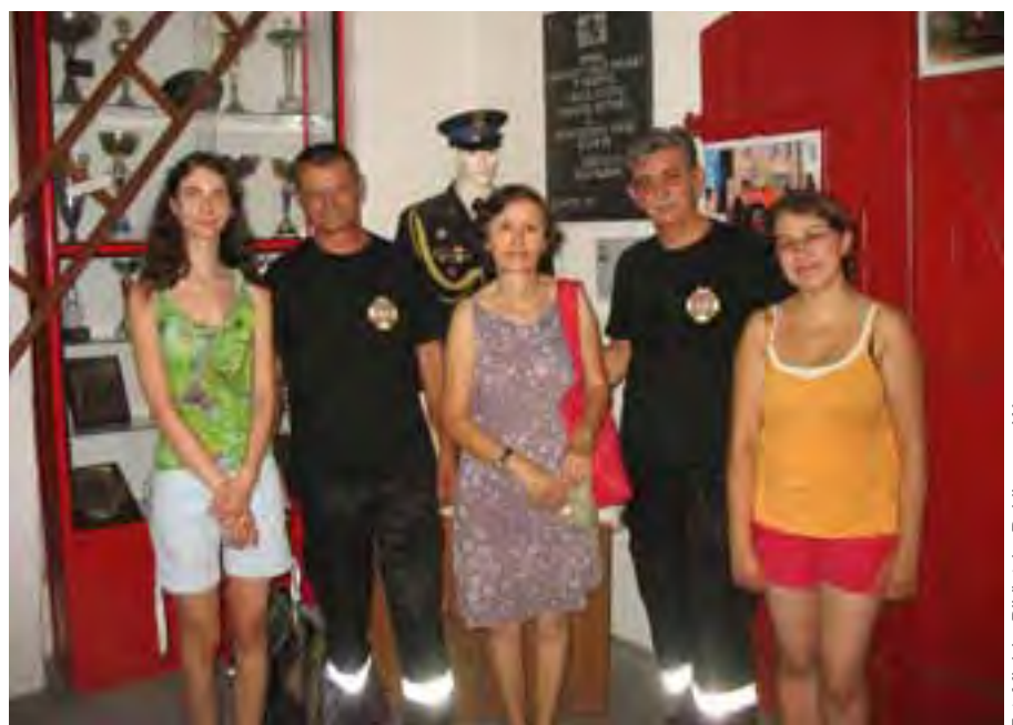
Zwiedzanie wspinalni Ochotniczej Straży Pożarnej w Wągrowcu

Zwiedzający Wągrowiec poznali historię kościoła poewangelickiego na ul. Cysterskiej i lapidarium na zboczu byłego cmentarza żydowskiego nad jeziorem Durowskim. Turyści choć bardzo zmęczeni byli zadowoleni ze spaceru po Wągrowcu i wyrazili chęć uczestnictwa w kolejnej wycieczce za rok.