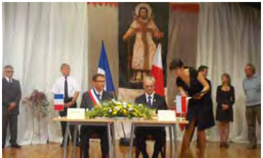
Podpisanie porozumienia o partnerstwie z przedstawicielem francuskiego Yvetot