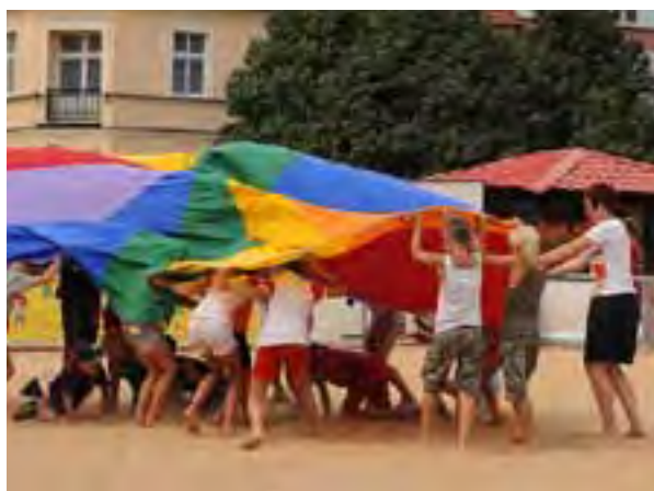
Fot. Szymon Gruchalski