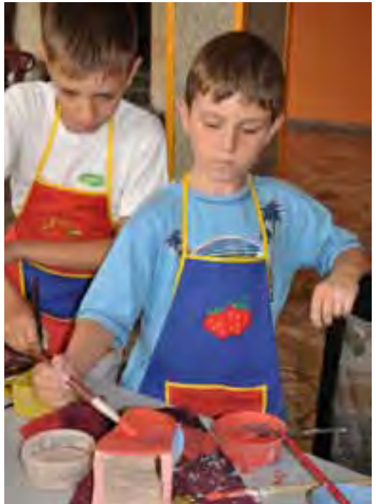
Zajęcia plastyczne w NOK-u

Wakacje z naszym ośrodkiem zakończyły plenerowe spotkanie „Pod Grabem”, podczas którego dzieci obejrzały spektakl „Beczka śmiechu”, miały okazję uczestniczyć w pokazie puszczania baniek mydlanych. Spotkanie pod Grabem zakończył koncert „Śpiewających Przyjaciół” z Nowotomyskiego Ośrodka Kultury.