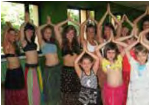
Warsztaty tańca Bollywood w NOK-u