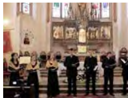
Octava Esemble – w trakcie występu w Lusowie

Pełnię możliwości ludzkiego głosu zaprezentował z kolei zespół Octava Ensemble. Krakowski oktet wokalny wystąpił w Lusowie 1 sierpnia. Grupa zaprezentowała zarówno utwory świeckie, jak i sakralne.