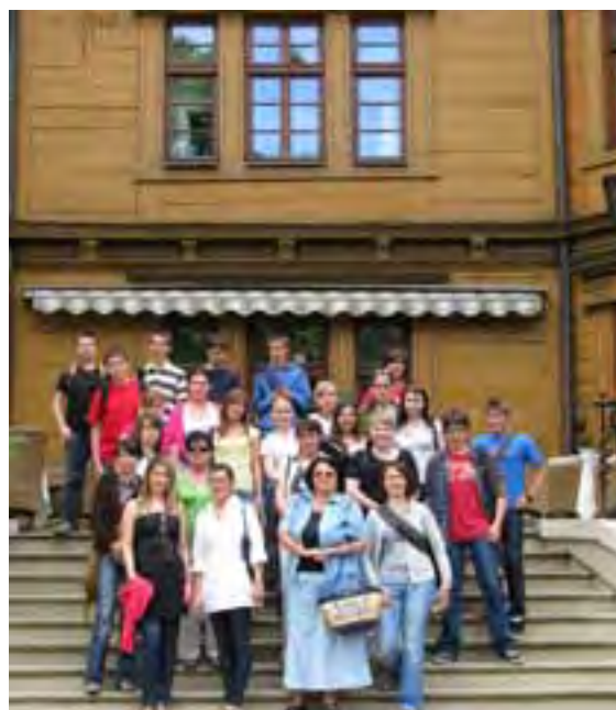
Przed pałacem w Antoninie