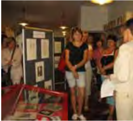
Zwiedzanie Miejskiej Biblioteki Publicznej w Wągrowcu