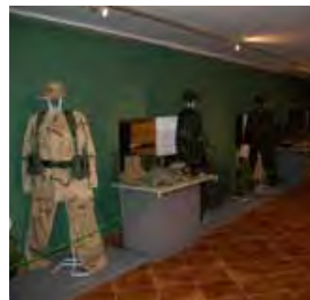
Fragment kolekcji Nieformalnego Stowarzyszenia Przyjaciół Militariów