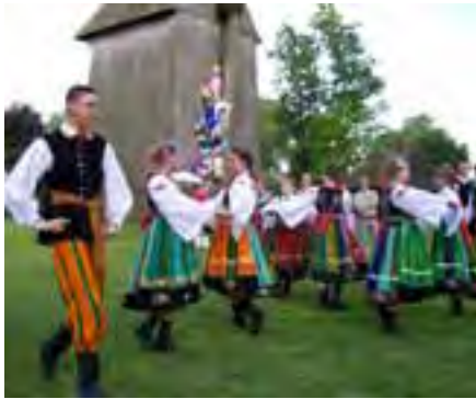
Występ zespołu tanecznego „Uśmiech” ze SP i Gimnazjum w Liściu Wielkim

26 czerwca w skansenie etnograficznym w Koninie zorganizowano po raz pierwszy Noc Świętojańską. Spotkanie rozpoczął polonez wykonany przez Zespół Taneczny „Uśmiech” ze Szkoły Podstawowej i Gimnazjum w Liściu Wielkim. Wkrótce potem ogłoszono wyniki II edycji konkursu dla rzeźbiarzy-amatorów, którzy odpowiedzieli na hasło „Trud pracy rolnika”.