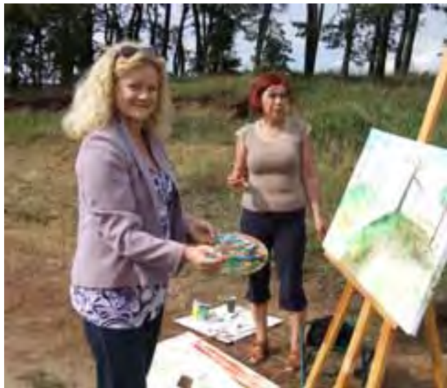
Uczestniczki pleneru przy sztalugach