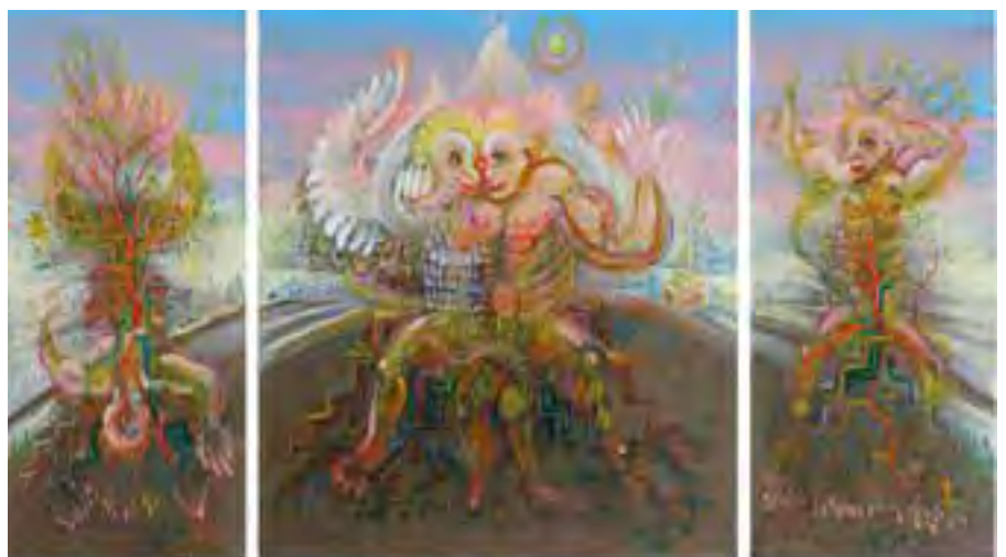
Gennadij Jeltsov, Pejzaż wewnętrzny tryptyk