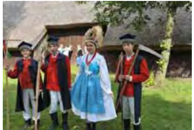
Zespół Pieśni i Tańca „Wiwaty” z Pobiedzisk