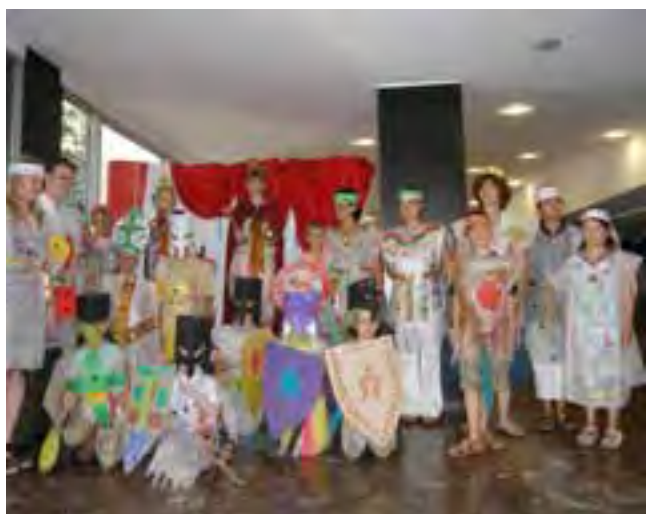
Uczestnicy warsztatów we własnoręcznie przygotowanych strojach

Wakacyjna oferta edukacyjna w MPPP składała się z kilku bloków tematycznych. Dla gości zwiedzających Muzeum przygotowano „Ekspонат tygodnia”. W każdy poniedziałek, w specjalnej przestrzeni typu „white cube” i na stronie internetowej, prezentowano wybrany