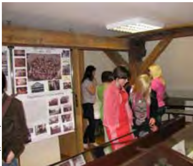
Wnętrze „Chaty Regionalnej” w Przygodzicach