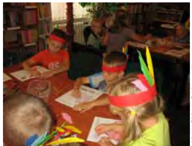
Dzieci przygotowują pióropusze na „Indiański poranek”

Ku wielkiej radości dzieci, wycieczka dotarła do zabytkowej wspinalni Ochotniczej Straży Pożarnej, gdzie strażacy przedstawili historię obiektu a następnie można było wejść na taras widokowy, skąd rozciąga się piękny widok na Wągrowiec. Na zakończenie wycieczki na dzieci czekała jeszcze jedna niespodzianka – zabawa w ogródku jordanowskim tuż przy wieży strażackiej.