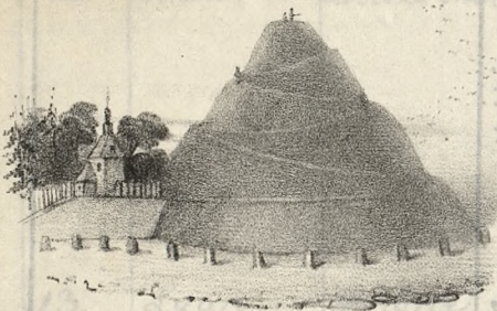
Montagne de Kosciuszko à Bronowice, près Krakovie.