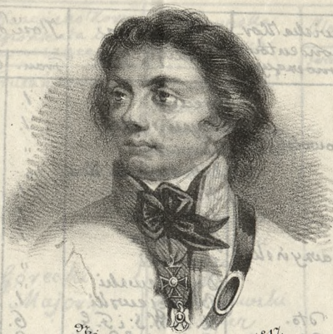
Né en 1746, Mort en 1817.