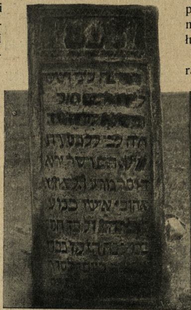
NAGROBEK KARAICKI Z KUKIZOWA (1831 R.)

Przywilej ten dał wpisać wójt karaicki do aktów grodzkich dopiero w r. 1723 i mniej więcej od tej też chwili zaczynają się dzieje gminy, zawsze jednak bardzo nielicznej. Wogóle liczba karaitów na Rusi i Litwie nie przechodziła nigdy kilku tysięcy, a według Czackiego wszystkich ich w XVII w. było 4430, w czem 2000 w Polsce. W ostatnim zaś spisie karaitów w r. 1790 było w Litwie i na Rusi—mężczyzn 2148; dodając równą liczbę kobiet, wypada liczba karaitów 4296 (Czacki str. 142). W 1870 r. liczbę wszystkich ich w Galicyi podaje Bened. Płoszczański około 250 dusz 1) . Według zaś ostatniego obliczenia z 1900 r. było ich w Galicyi razem stu sześćdziesięciu, osiadłych tylko w Haliczu i Załukwi. W Kukizowie bowiem, miasteczku położonem na półn. wschód niedaleko od Lwowa, przebywało kilka rodzin karaickich tylko czas krótki po 1831 r., poczem bardzo nieliczne młode pokolenie wyemigrowało,