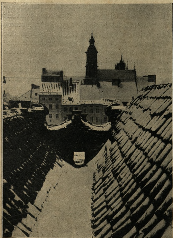
fol. H. Unruh