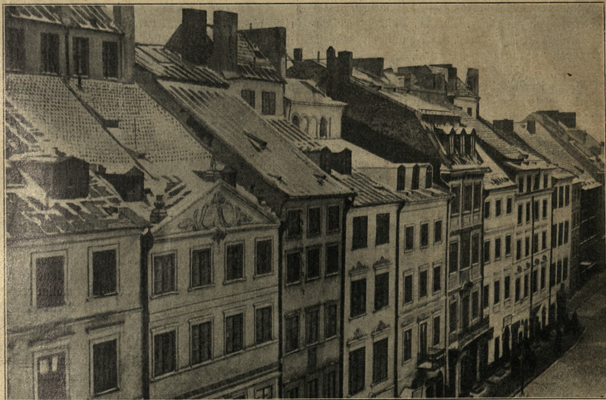
fol. J. Jaroszyński