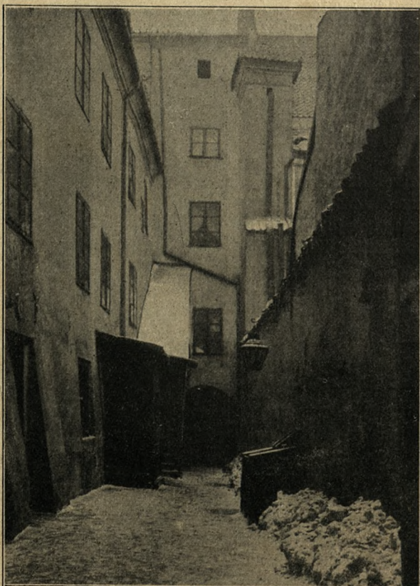
PODWÓRKO DOMU BARYCZKÓW

Mogłoby być zaiste inaczej. Niema przecież mowy i tego żaden z najzagorzalszych fanatyków nie wymaga, aby doprowadzać tę czy