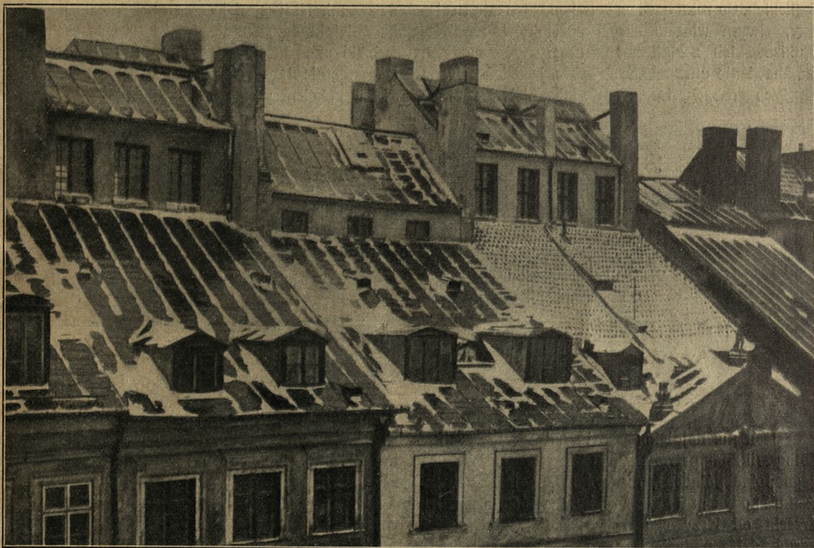
SZCZYTY DOMÓW STAREGO MIASTA