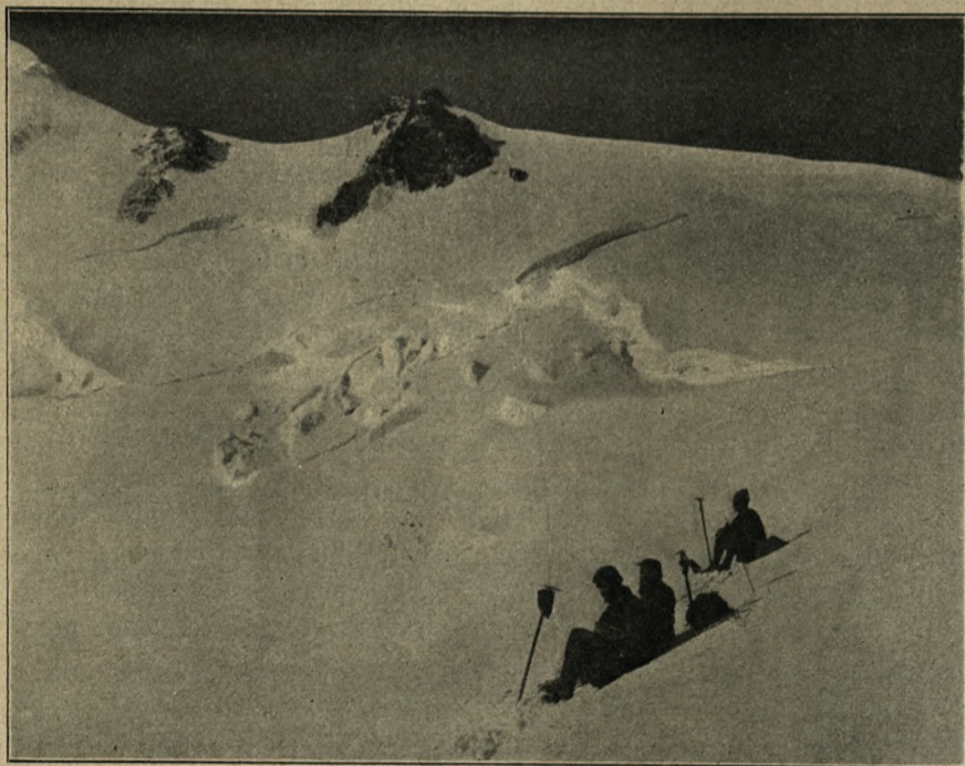
NA GRAND PLATEAU (4100 m.). W górze pośrodku Rocher des Bosses (1360)—na lewo początek Garbów