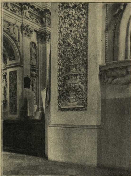
GIPSATURY W KOŚCIELE ŚŚW. PIOTRA I PAWŁA NA ANTOKOLU W WILNIE