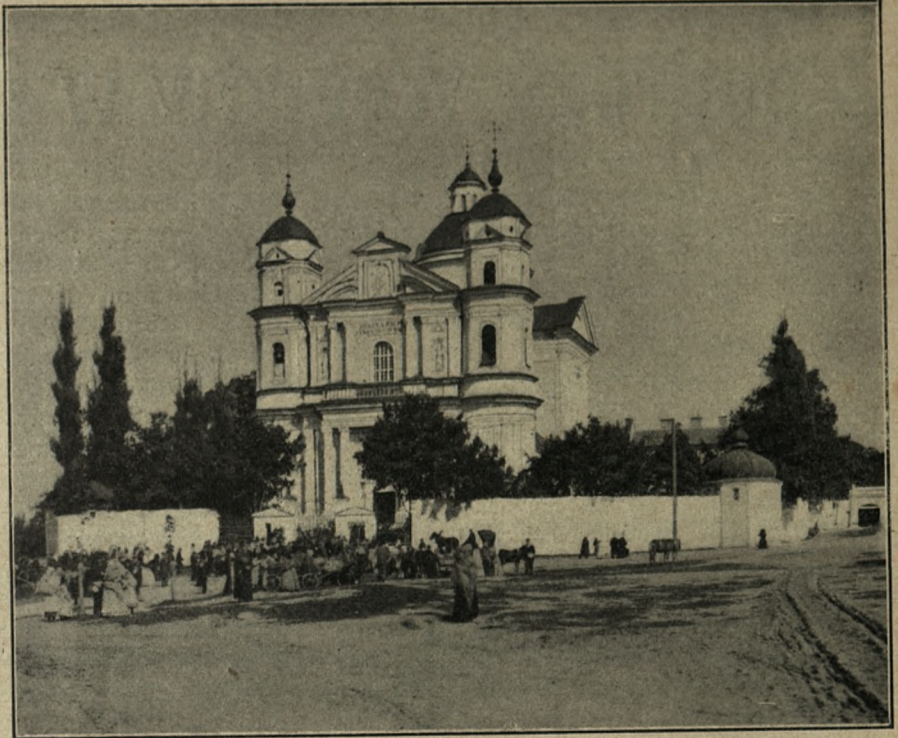
fol. W. Zahorski

Skarbiec jest bardzo bogaty i z przechowywanych w nim przedmiotów można i należy utworzyć przy kościele muzeum pacowskie. Są tu wspa-