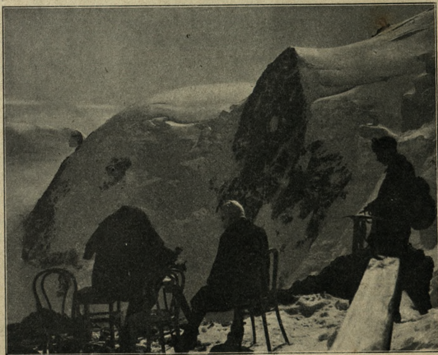
fol. J. Jaroszyński