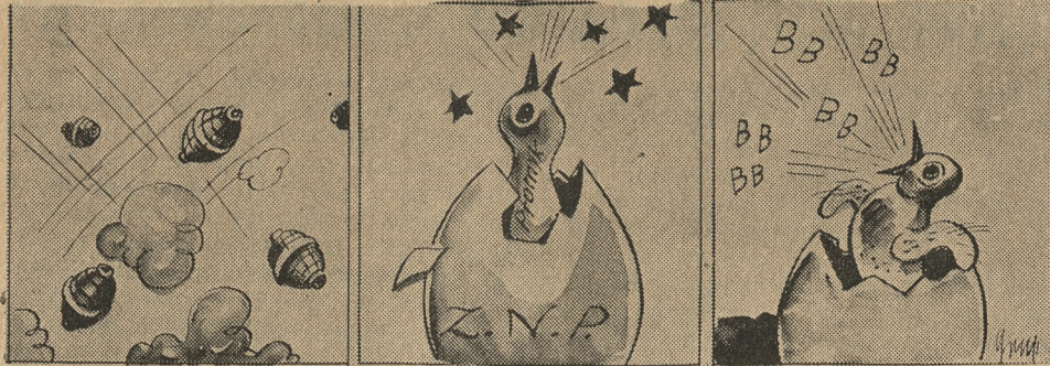
1. Hiszpańskie. — 2. Nauczycielskie. — 3. I inne.