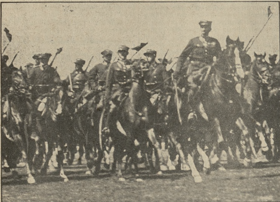
Podczas wspaniałej rewji kawalerji polskiej w Krakowie, wyróżniły się brawurą postawą, karnością i zgraniem w defiladzie, z której fragment zamieszczamy, pułki wielkopolskie: 15 pułk ułanów z Poznania i 17 pułk ułanów leszczyńskich.