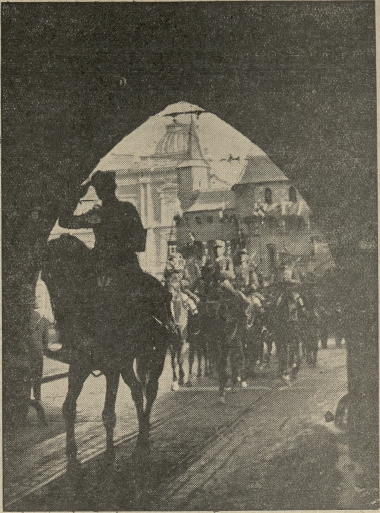
Wielka parada 12 pułków kawalerji polskiej na Błoniach krakowskich była jednocześnie rewją teźny i wspaniałej postawy naszej współczesnej husarji. Barwne pułki ułańskie przejeżdżały ulicami Krakowa wśród owacy rozentuzjzmowanych tłumów. Na zdjęciu widzimy czoło 17 pułku ułanów z Leszna, w chwili gdy wkracza do Krakowa przez bramę Florjańską.