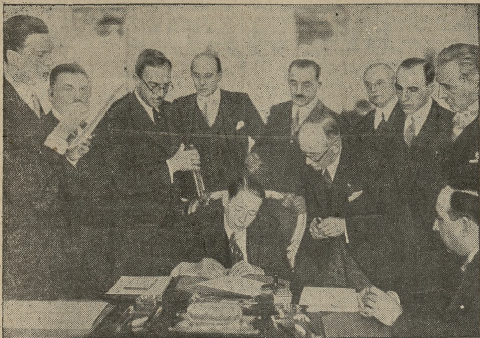
Uczestnicy praskiej konferencji Małej Ententy

w chwili podpisywania paktu organizacyjnego Małej Ententy. Przy stole podpisuje egzemplarz paktu rumuński minister spraw zagranicznych Titulescu. Na prawo obok niego minister Benesz; w prawym rogu siedzi min. Jętic, przedstawiciel Jugosławii.