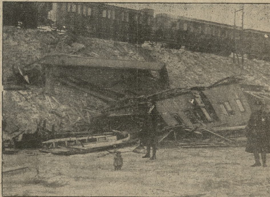
Z pod rozbitych wagonów kolejowych poczęto wydobywać zabitych i rannych.