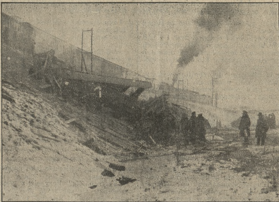
Ogólny widok miejsca katastrofy.