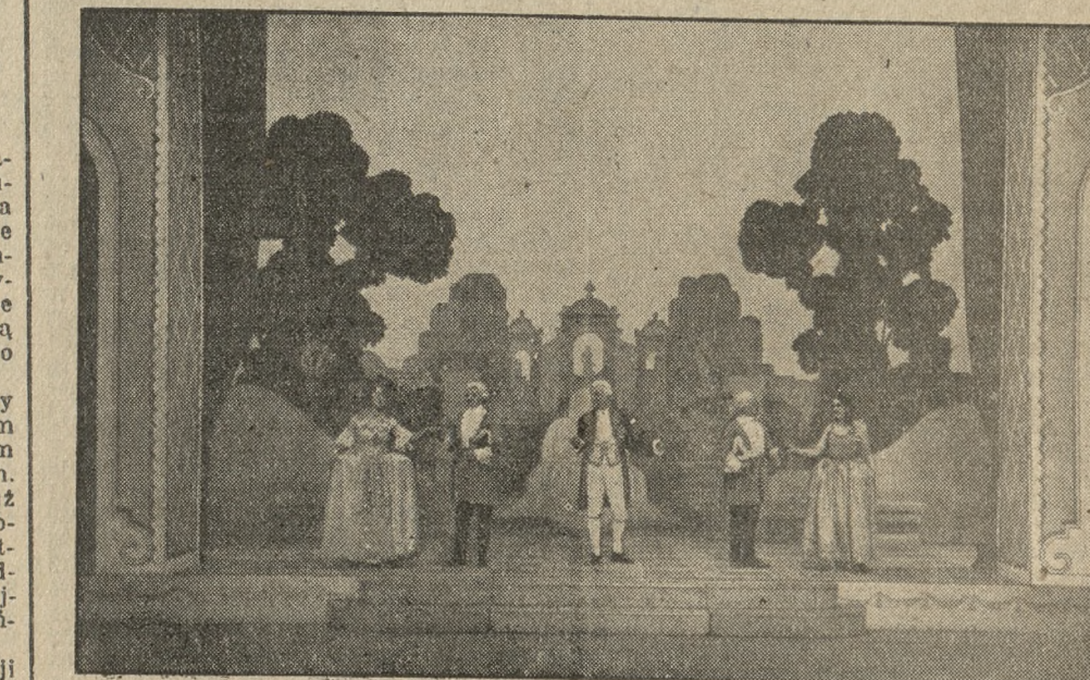
Teatr Wielki wystawił bardzo efektownie i z wielkim nakładem pracy artystycznej operę komiczną Mozarta „Cosi fan tutte”, w Polsce dotychczas niespiewaną. Na zdjęciu widzimy główne postacie opery — którą dyryguje dyr. Latoszewski, a którą wyreżyserowała p. Janowska-Kopczyńska — na tle pięknych dekoracji Z. Szpingiera, przedstawiających rokokowy ogród.

Któż opisie jednak zdumienie policji stanu Illinois, gdy ta schwytała przy nowym „wyczynie” złodziejskim „Pięknego Janka”, i nagle opadły ją wątpliwości. Jest to on, czy nie? Jak porównano bowiem z fotografiami, to się przekonano, że zmienił się gruntownie z nosa, profilu i wogóle