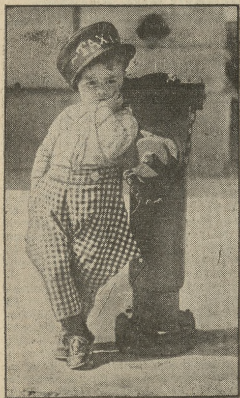
„Ciężko z tym kryzysem” — zda się mówić ta zasmucona twarzyczka. Ludzie nie jeżdżą taksówkami nawet wtedy, gdy niemi kieruje taki dzielny szofer, jak ten oto, przedstawiony na zdjęciu.