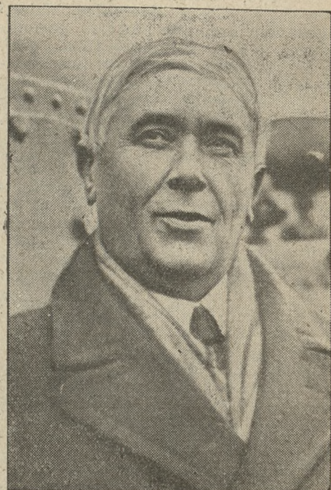
Maurycy Maeterlinck znakomity poeta belgijski i laureat Nagrody Nobla. Z okazji jego 70-lecia król belgijski nadał mu tytuł hrabiego, a rząd francuski odznaczył go w stopniu komandora Legii honorowej