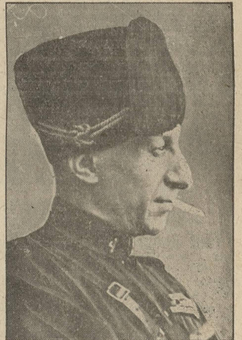
Turatj, b. sekretarz generalny partji faszystowskiej, który ostatnio popadł w nielaskę u Mussoliniego, nie zrezygnował jednak i postanowił bronić się przed wielką radą faszystowską, której jest dożywo-t-nim członkiem.

(z) Nowe cła bojowe w Niemczech. Jednym z przejawów niemieckiej polityki gospodarczej, idącej po linii coraz szerzej stosowanej autarchji, jest nowa niespodziewana podwyżka taryfy celnej, ogłoszona w nr. 56 dziennika ustaw Rzeszy. Podwyżka ta uzupełnia zarządzenie podwyżek celnych, wydane w poprzednim nr. dziennika ustaw, obejmujących szereg artykułów produkcji rolnej, hodowlanej i przemysłowej. Nowe podwyżki weszły w życie z dniem 6 b. m. Obejmują one m. in. przedzę bawełnianą, tiul, przedzę rami, powrozy, tkaniny lniane, jutę, płótno intro-ligatorskie, ręczniki, tkaniny nieprzemakalne, linoleum, odzież nieprzemakalna, skóry, pendzle, filmy, papier, żelatynę, azbest, sztuczne zęby, maszyny do pisania, kasy rejestracyjne, wagi precyzyjne, maszyny do szycia, ogórki, soki owocowe, herbatę, budulec, zótko płynne, oliwę palmową, ocet winny, brom, potas, amoniak, artykuły galanteryjne, dywany, aksamit i plusz. Podwyżki te wahają się w granicach od kilkuset do kilkudziesięciu procent do kilkuset procent (odzież nieprzemakalna, sztuczne zęby), przyczem z państwami traktatowymi stawki dotychczasowe zostały utrzymane. O celowości tych nowych zarządzeń i o charakterze bojowym świadczy fakt podwyższenia cel na niektóre artykuły, które jak np. chemikalja nie wymagają żadnej ochrony celnej, ponieważ posiadają dodatni bilans w obrótach z zagranicą. Na podkreślenie zasługuje również fakt, iż podwyżki obecne obejmują szereg artykułów, na które cło podwyższane było w b. r. już parokrotnie.