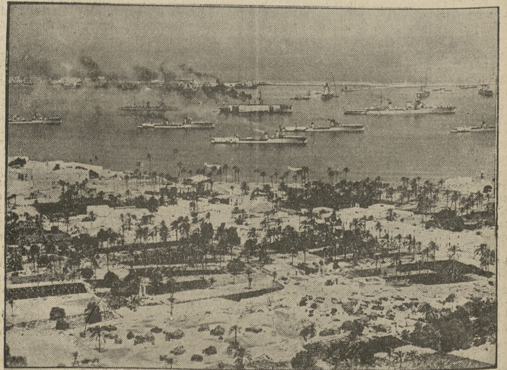
Wielkie manewry morskie włoskiej floty wojennej. Na zdjęciu jednostki wojennej marynarki Włoch, biorące udział w tego-rocznych manewrach, przed portem w Tripolisie.

Wyszedł z pod prasy specjalny nr. „Pająka”, omawiający w dalszym ciągu wydzierzawienie lokalu żydowskiej firmy „Photomaton”, — jak również bliższe dane co do właścicieli żydowskiego kina „Roxy”. „Pająk” jest do nabycia w „Ruchu” i u kolporterów w cenie 10 gr. za egzemplarz.