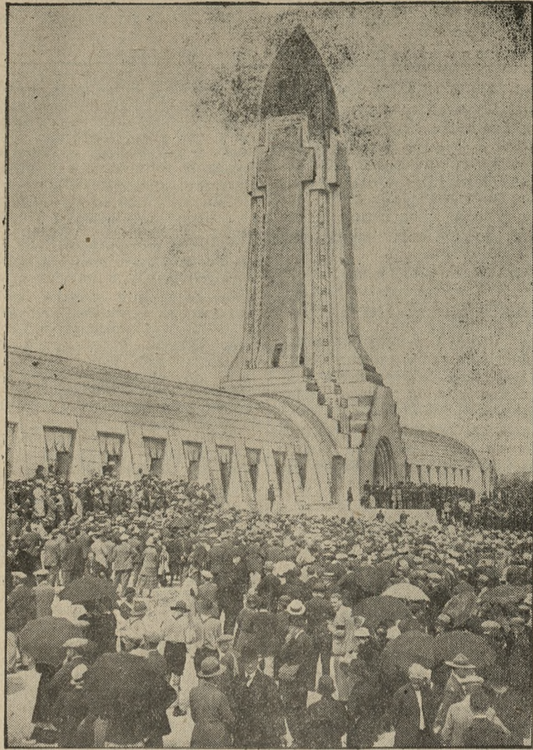
W obecności najwyższych władz kościelnych i państwowych z prezydentem Francji A. Lebrun na czele odsłonięto w Douaumont, pod Verdun, wielki pomnik narodowy ku pamięci 400 000 żołnierzy, poległych w czasie bohaterkiej obrony twierdzy Verdun. Odstonięcie wspaniałego pomnika było wielką manifestacją narodową Francji ku czci poległych bohaterów.