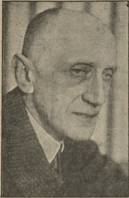
Karol Hubert Rostworowski

znakomity dramaturg, laureat tegorocznej literackiej nagrody państwowej. Prapremjera jego ostatniej sztuki „U mety”, która odbędzie się jutro w Poznaniu w Teatrze Polskim, jest najpoważniejszym wydarzeniem w polskim życiu kulturalnym czasów dzisiejszych