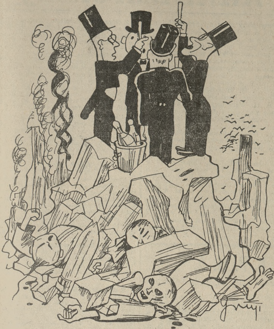
Zdrowie Ligi Narodów!