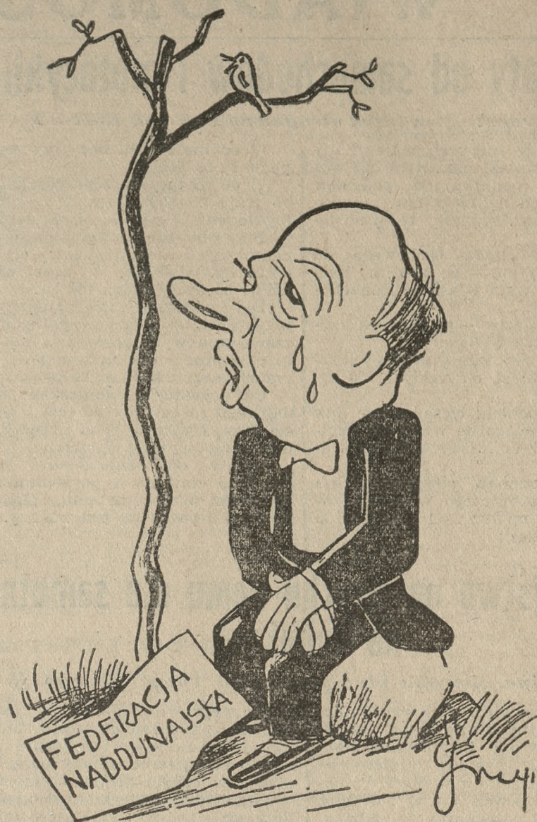
Sam jeden, sam jeden, na cały ten świat.

resów, cechowały tego dzielnego szermierza o Wielką Polskę. Zalety te zjednały mu mir i poważanie kolegów i całkowite uznanie władz Obozu Wielkiej Polski.