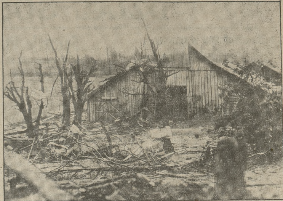
Południowe stany Ameryki nawiedzone zostały okropnym w skutkach orkanem t. zw. tornado. 200 osób postradało życie, a przeszło 1 000 zostało ranionych. Oto obraz nędzy i rozpacz, jaki zostawił po sobie rozszalały żywioł na tury.