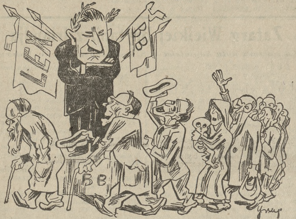
Ave Car, emeryturi te salutant!