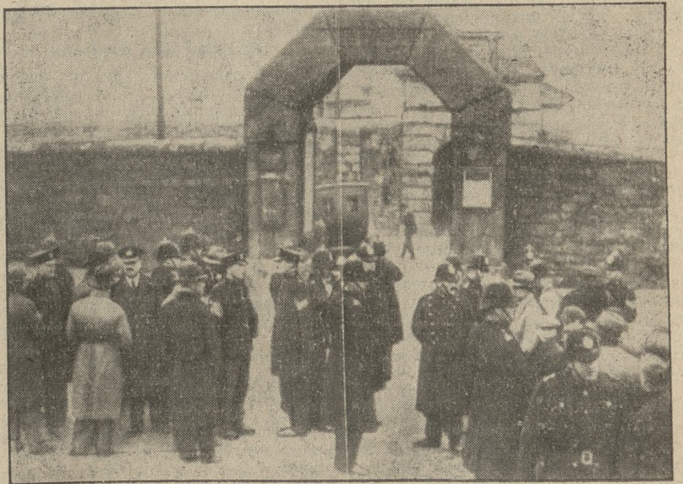
W Dartmoor, w Anglii, wybuchła w tych dniach groźna rewolta więźniów, którą z trudem tylko udało się opanować. Zdjęcie powyższe z owego zajścia zostało rozesłane z Anglii w drodze radiowej.

Ci, którzy znają problem ruchu kołowego w Paryżu, wiedzą, że w stolicy nadsekwaniańskiej tramwaj jest skazany na wygnanie. Kursowanie bowiem wchikulu, który nie może się przystosować do potrzeb chwili i jest raz na zawsze związany ze stałym torem, stało się wobec olbrzymiego natłoczenia ulic paryskich niemożliwością. Zarząd towarzystwa, które finansuje wszystkie tramwaje, autobusy i motorówkę pasażerskie w obrębie Paryża, ma zamiar wyeliminować z ruchu kołowego środki komunikacyjne, które zbyt często stają się powodem zablokowania ulic. Takim właśnie środkiem jest tramwaj. Już od początku bieżącego roku zniesiono jedenaście linii tramwajowych. Ogółem już znikło w przeciągu pięciu lat z ulic Paryża 54 linii. Ich miejsce zajęły olbrzymie wozy autobusowe, mieszczące każdy z nich 60 osób. Dla wygody obywateli, mieszkających na przedmieściach Paryża, mają być zaprowadzone specjalne bilety do przesiadania, upoważniające do korzystania z autobusu w obrębie miasta i z tramwaju na jego peryferjach. W przeciągu kilku lat tramwaje znikną z Paryża całkowicie i przeniosą się na dalekie jedynie przedmieścia, gdzie nikomu nie będą zawadzały. (S. F.)