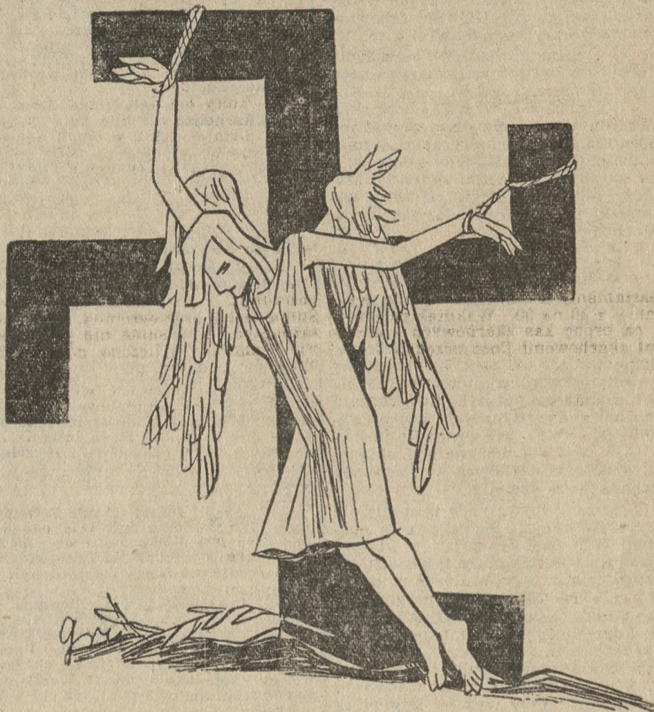
Krzyż, na którym zawisnie pokój światowy.