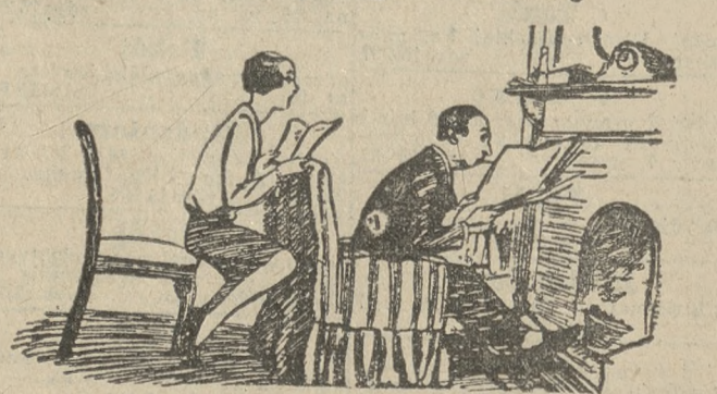
Zona motocyklisty w domu, czyli siła przyzwyczajenia. (Passing Show, Londyn). S. F.

Przedpiata na styczeń 1932 za oba wydania razem wliczając tygodniowego dodatku ilust. „Ilustracja Poznańska“ i „Nowiny Sportowe“ w Poznaniu w Poznaniu z 4.70, w agencjach w mieście z 4.50, z odnośnikiem kwartalnie z 15.03, pod opaską miesięcznie w Polsce z 9.00, w innych krajach z 11.00. W razie wypadków spowodowanych siłą wyższą, przeszkód w zakładzie, strajków i t. p. wydawnictwo nie odpowiada za dostarczenie pisma, a abonenci nie mają prawa domagania się niedostarczonych numerów lub odszkodowania. Ogłoszenia na stronie 6-lamowej 25 gr. na stronie 4-lamowej przy końcu tekstu redakcyjnego 60 gr. na stronie czwartej 100 gr. na stronie drugiej 120 gr. przed wiadomościami pocztowymi 200 gr. od 1-lamowego miliona porannego przyjmujemy do godz. 18.30 w nagłych wypadkach do godz. 22 u stróża; do wydania wieczornego „drobne“ do godz. 11. większe dłużej według możliwości. Drobne ogłoszenia: słowo napisowe (tuste) 25 gr. każde dalsze słowo 15 gr. Za różnicę między zestawem a wysokością ogłoszenia, powstałe wskutek matrycowania, wydawnictwo nie odpowiada. W wydaniach wielkoświątecznych i uroczystościowych poprzedza normalną codzienną część numeru z reklamami i ogłoszeniami, materiał poświęcony danej uroczystości. Telefony do Redakcji i Administracji: 4461, 1476, 3307, 3524, 3525, 4072, w niedzielę, święta i nocą tylko 1476 i 3524, filja Stary Rynek 2305. — P. K. O. Poznań nr. 200 149.