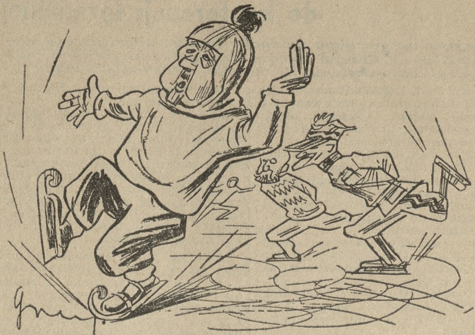
Prystor: — Świetna ślizgawka, cóż, kiedy pewnie wywrócę się wkrótce!