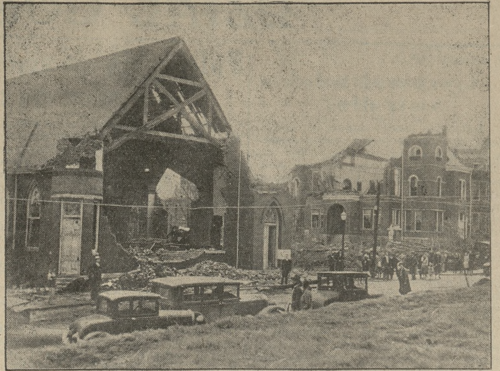
Skutki straszliwego tornada w stanie Arkansas w Ameryce Północnej. — Na zdjęciu widzimy miasteczko Camden, dotknięte katastrofą.

Ciekawe zjawisko, powstałe na tle kryzysu gospodarczego, dające się już od-