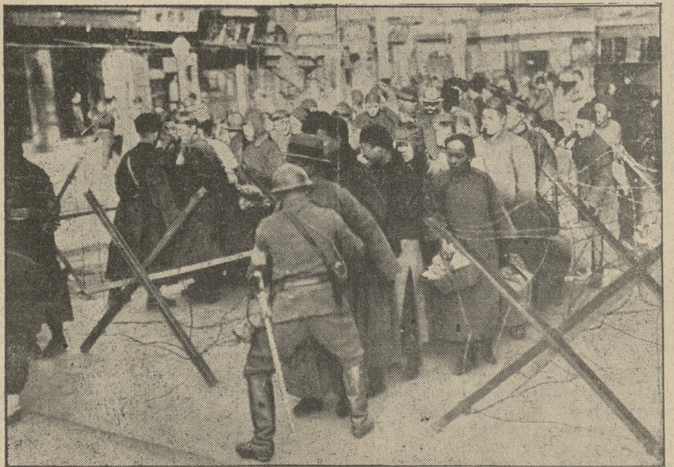
Obrazek z wojny chińsko - japońskiej. Zandarmerja japońska w Tien-Czinie bada ludność chińską przy wejściu do miasta.

W czwartek, dnia 7 stycznia 1932 roku, urządza Harcerska Drużyna Wilków Morskich na sali „Boulevard” przy placu Nowomiejskim przedstawienie p. t. „OGNI-SKO HARCERSKIE”. Program obfituje w wesołe sceny z obozu, tryskające prawdziwym humorem harcerskim. — Prócz „Ogniska”, odegran będzie jednoaktówka p. t. „Marynarz”, oraz na zakończenie scena zbiorowa: „Wielka Parada Wilków Morskich”, w której bierze udział przeszło 100 osób. Ceny popularne od 50 gr. do 2 zł. Początek o godz. 19.30. zw 12 605/6