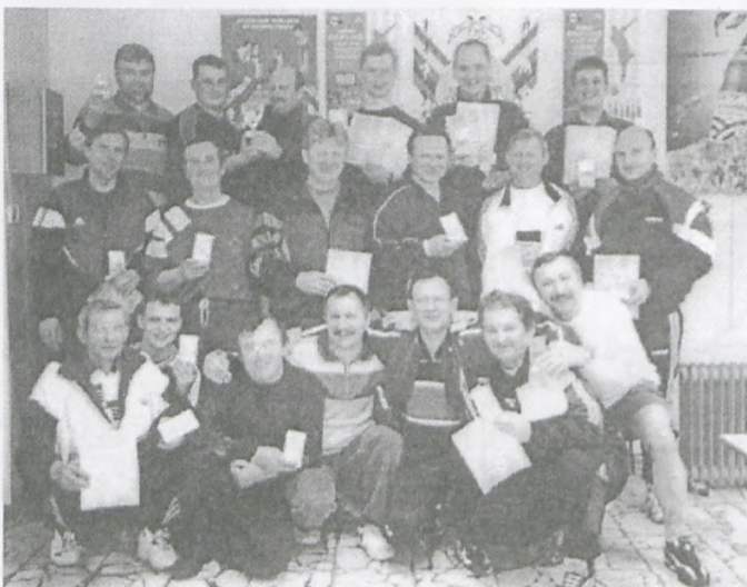
Uczestnicy Międzygminnej Ligi Kreślarskiej