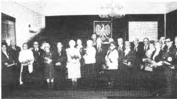
Parę podczas uroczystości w Ratuszu