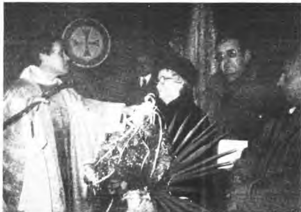
Jubilat odbiera kwiaty od jednej z delegacji.