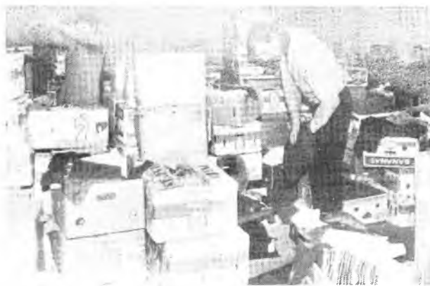
Śród darów można wybrać potrzebne ubrania i sprzęty.

Podopieczni ośrodka odbierają dary po uprzednim wezwaniu, tak aby nie powodować kolejek i zamieszania. Pracownicy w tym przedświątecznym okresie mają wiele pracy wymagającej cierpliwości i wyrozumiałości. - Rzeczy powinny być porożkładane na półkach, aby odbierający mieli swobodny do nich dostęp. Powinien być też rozwiązany problem z rozładunkiem transportu. W następnym tygodniu staniami przed kolejnym wyzwaniem, kiedy