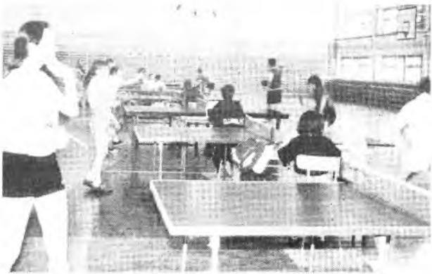
Po raz pierwszy zawody tenisa stołowego odbyły się w sali Liceum Ogólnokształcącego.