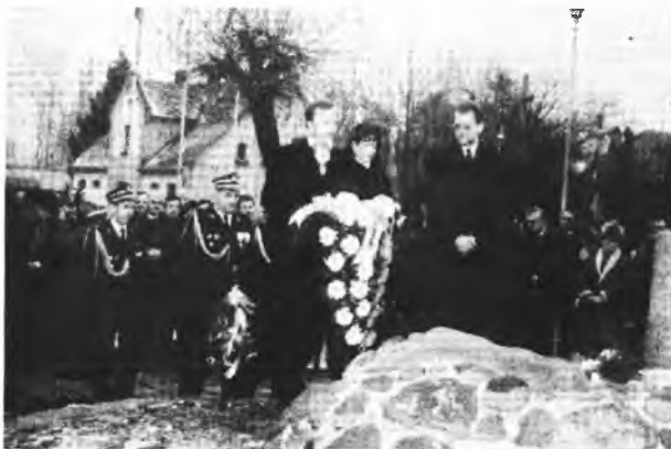
Delegacja składają kwiaty przy obelisku premiera Mikołajczyka

czący Komisji Rolnictwa. Mówił o zmianach jakie muszą nastąpić w polskim rolnictwie w związku z planowanym przystąpieniem Polski do Unii Europejskiej. Nasze rolnictwo oparte na zasadach gospodarstw rodzinnych nie jest tak oddalone od modelu gospodarstw zachodnich. Zdrowa, dobrej jakości żywność, stanowi element konkurencyjny na rynkach światowych. Dlatego zachodnie rolnictwo obawia się przystąpienia Polski do unii. Nie mamy się czego wstydić, nie jesteśmy gorsi.