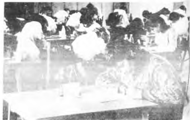
W trakcie pisania

Dyrektorzy i nauczyciele mieli za zadanie popełnić jak najwięcej błędów ortograficznych. Za każdy błąd otrzymywali jeden punkt.