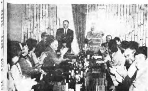
Podpisanie umowy było okazją do spotkania delegacji Gasselte z radnymi.

nośnie budowy rurociągu przesyłowego długości 8 km, łączącego Witaszycze ze Stefanowem. Inwestycja powinna być gotowa na koniec czerwca. Do tego wodociągów podłączonych zostanie 60 odbiorców indywidualnych i zbiorowych z Prus oraz Witaszyc. (rk)