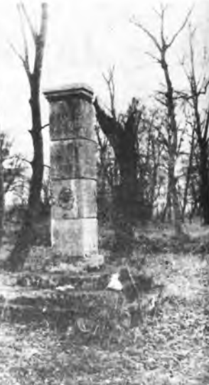
Zrzucona figurka Najświętszej Marii Panny w parku w Brzóstkowie (fot. L. Bajda).

W wyniku zmian użytkowników oraz braku działań pielęgnacyjnych zmienił się niekorzystnie układ przestrzenny parku, zatarciu uległy alejki i drogi dojazdowe, całkowicie zniknęło ogrodzenie oraz pierwotne granice całego zespołu. Jednakże pomimo wielu