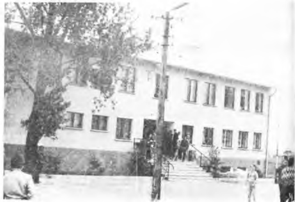
Świetlica w Sławoszewie na kilkanaście minut przed otwarciem