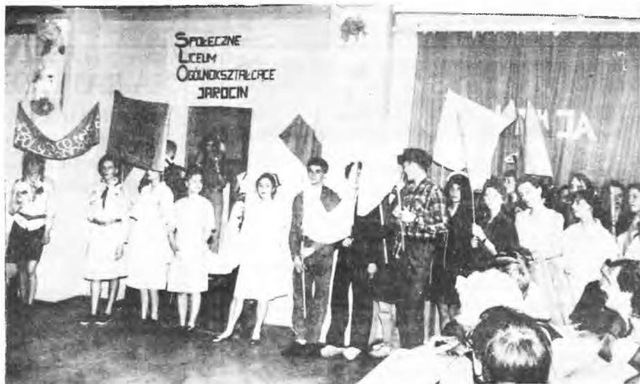
Pochód w SLO

odbitki amatorskie - termin 1 dzień Bezpłatne wywoływanie filmów (f 682)