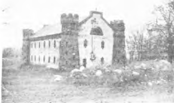
Zabytkowy spichlerz neogotycki na skraju parku w Brzóstkowie.