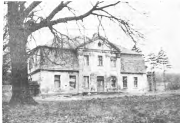
Dwór w Brzóstkowie z najbliższym otoczeniem parkowym (fot. L. Bajda).

czynnych, głównie gospodarskich. W czasie, gdy majątek brzóstkowski należał do Antoniego Poninskiego, wybudowano na początku XIX w. nowy dwór klasycystyczny, kryty łamanym dachem z na-